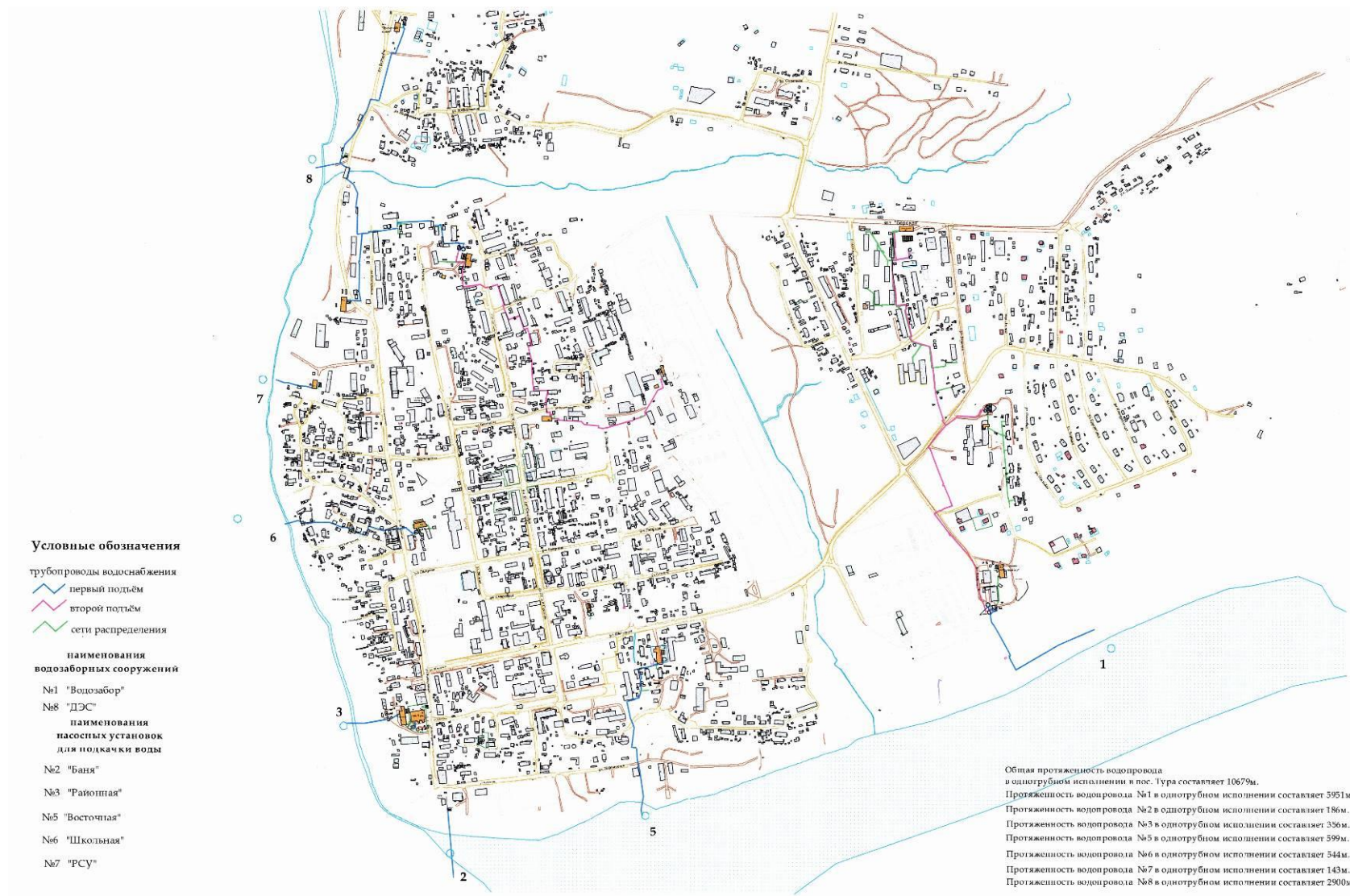
Рисунок 1 – Существующая и перспективная система водоснабжения п. Тура