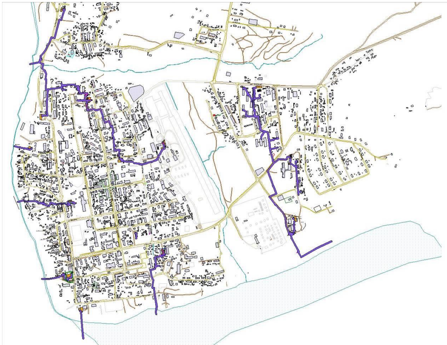
Рисунок 2 – Зоны эксплуатационной ответственности водоснабжения в п. Тура МП ЭМР «Илимпейские теплосети»