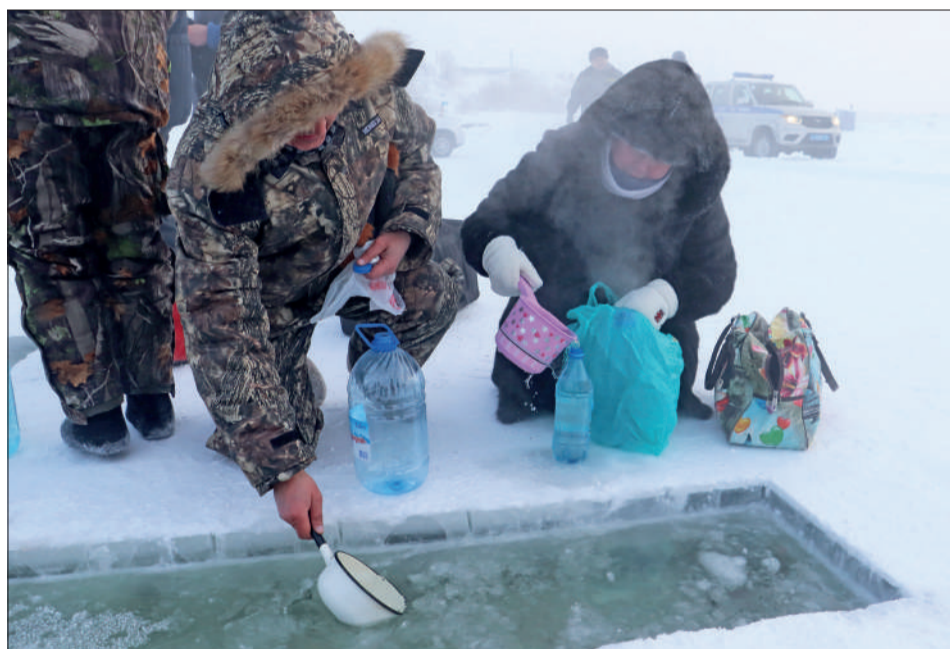
До самой ночи люди приезжают к проруби набрать освященной воды