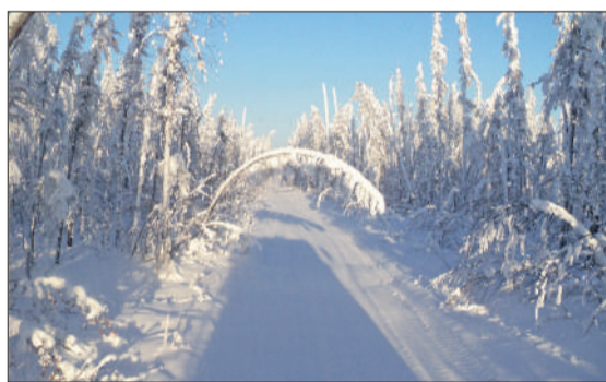
Для многих зимники не только работа, но и романтика

– Дороги в принципе хорошие. Иду по трассе – всегда встречаю дорожную технику: где-то чистят, где-то проминку делают. Сейчас дорожники трудятся на совесть. Знают, что в случае чего, будет жалоба. Поэтому стараются не доводить до критики. Мне есть с чем сравнивать. 20 лет назад, когда я только начал работать дальнбойщиком – дорог, можно сказать, и не было... Сейчас спокойно можно и на легковушке проехать в Туру, Нидым, да в любой поселок Эвенкии.