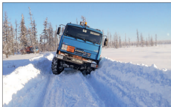
Отправляясь в рейс по эвенкийским маршрутам, нужно быть готовым ко всему

В этом сезоне в первый рейс из Красноярска в Туру я отправился 19 декабря – это на неделю позже, чем в прошлом. Осень теплой была, поэтому дольше пришлось ждать, пока промерзнут ледовые переправы. Будем надеяться, что зимники продержатся нынче долго. Вообще, еще и в апреле ездим. А как-то было, что из Ессее я выехал 6 мая – и дорога была вполне сносной.