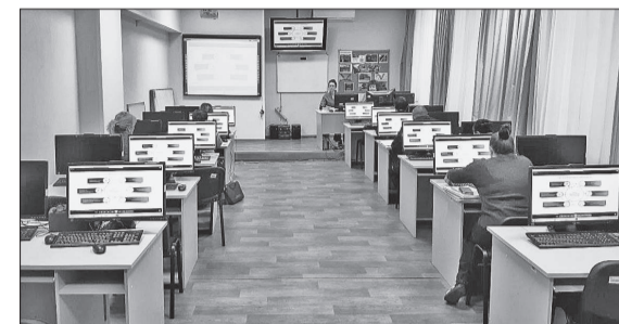
📷 Подготовка к обучению интервьюеров

■ Статистики приступают к проведению выборочного наблюдения доходов населения и участия семей в социальных программах.