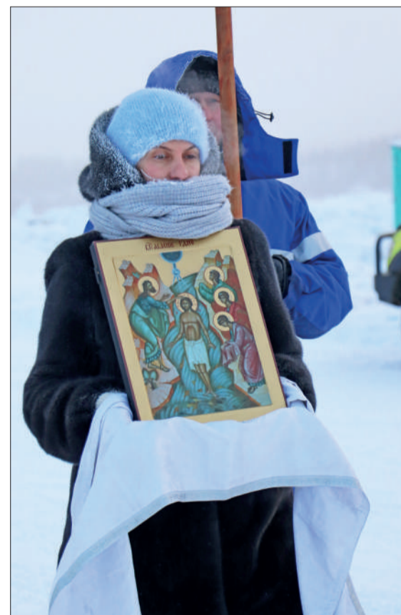
Несмотря на сильный мороз, крестный ход состоялся