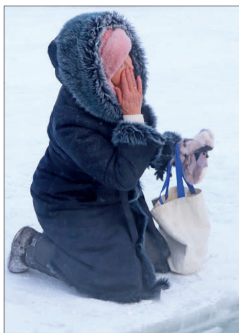
Сильные духом и верой люди