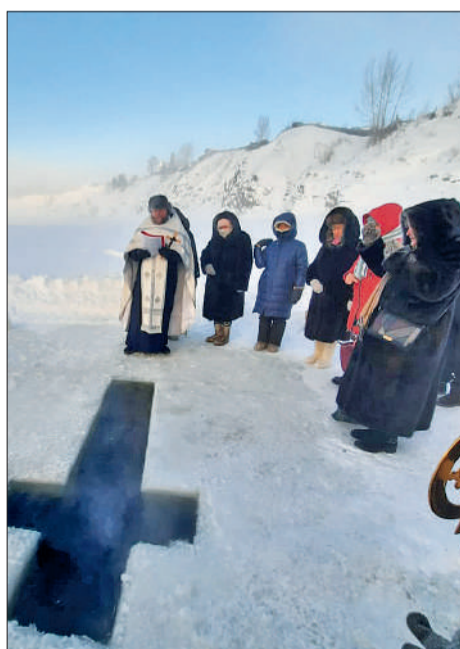
Иордань на Подкаменной Тунгуске