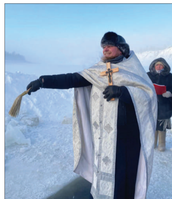
Чин великого освящения воды