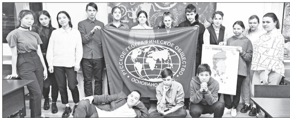
📷 Участники Молодёжного клуба РГО с. Байкит