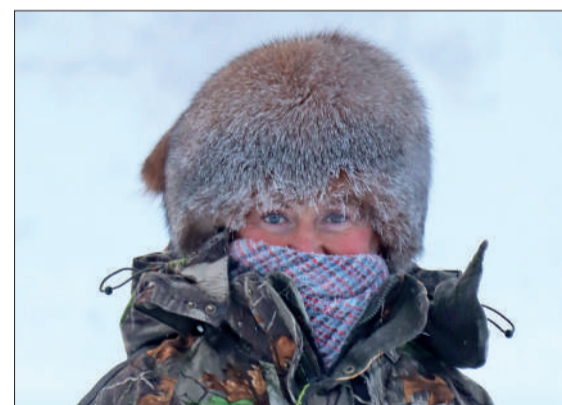
Искренняя радость от светлого праздника