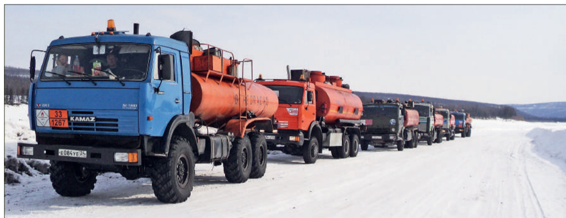
Завоз грузов по зимним дорогам – жизненно важная составляющая обеспечения поселков

– Если стоят экстремально низкие температуры, я предпочитаю немного переждать. Здесь холод настиг меня уже на трассе, выбора не было. В принципе, добрался нормально, без поломок. Но может случиться все, что угодно, а на