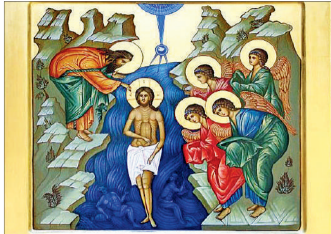
☞ Икона Андрея Рублёва «Крещение Господне»

Крещение Господне начали праздновать еще, когда были живы апостолы. В первые века христианства на Богоявление крестили новообращенных. Уже тогда была традиция освящать в этот день воды в водоемах. Центральные фигуры на всех иконах праздника – Христос и Иоанн Креститель, который возлагает правую руку на голову Спасителя. Десница же Христа поднята в благословляющем жесте. Духовенство