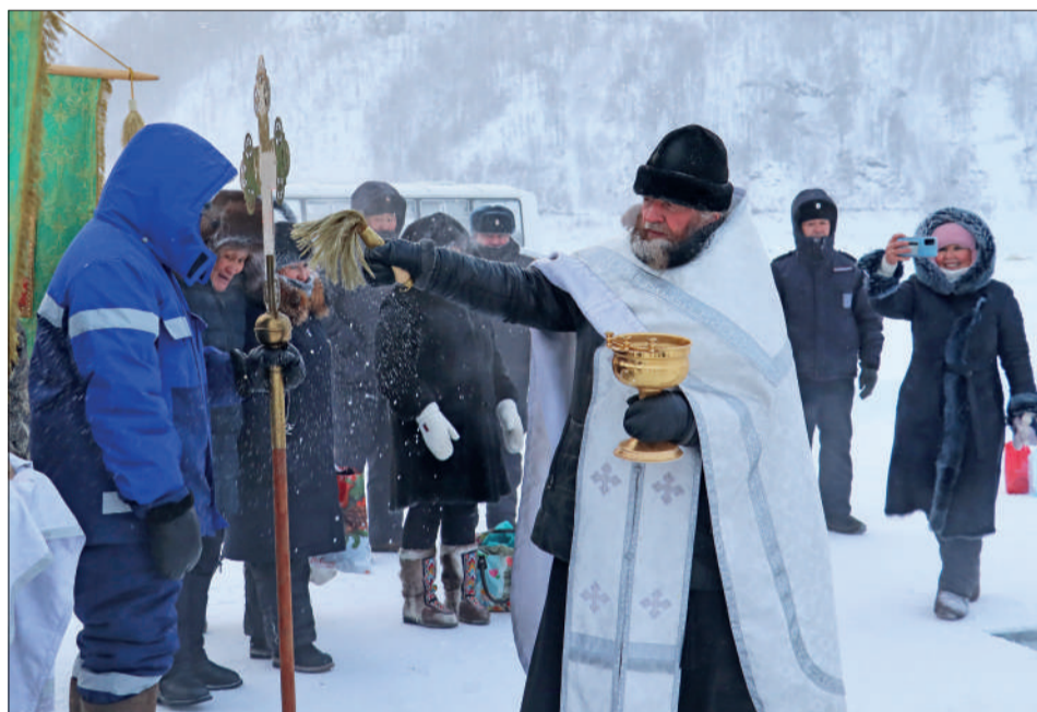
Святая вода – источник Божьей благодати