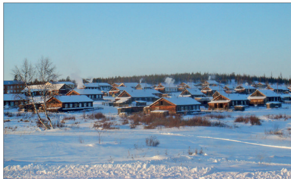
По зимникам планируется доставить в Эвенкию 22 тыс. тонн топлива

■ На зимних автодорогах Эвенкии – горячая пора. В поселки района осуществляется доставка ГСМ и других товарно-материальных ценностей.