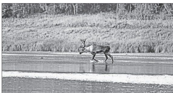
☉ На постоянстве привычек диких оленей основана тактика охоты на них

С достаточной точностью неизвестно, что именно заставляет диких оленей предпринимать правильные странствования, но только заметно, что эти странствования предпринимаются ими по определенному направлению и по раз проложенному пути через тундры, речки, избирая одни и те же места переправы через последние. На этом-то постоянстве привычек диких оленей и основана инородцами тактика осенней охоты на них. Когда близится время странствования, вся орда инородцев данной местности сосредотачивается у таежной речки. Люди прячутся, приготовив предварительно малень-