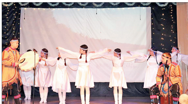
📷 Танец птиц

мирование интересов и культурного досуга.