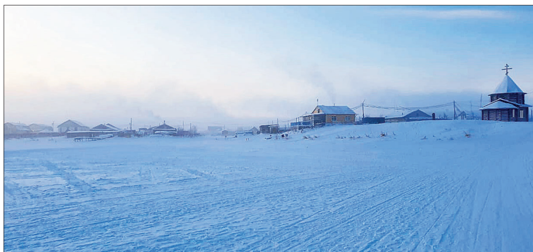
📍 На улице жители практически не выходят