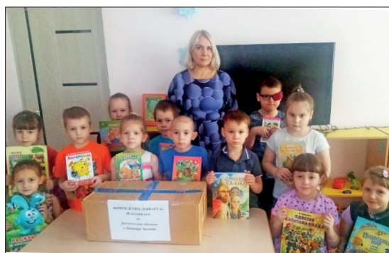
📷 Детям Донбасса – от детей Ванавары

На общем собрании принято совместное решение родителей и воспитателей поддержать акцию. Дошколята приносили книжки и с удовольствием делились сборниками сказок и рассказов,