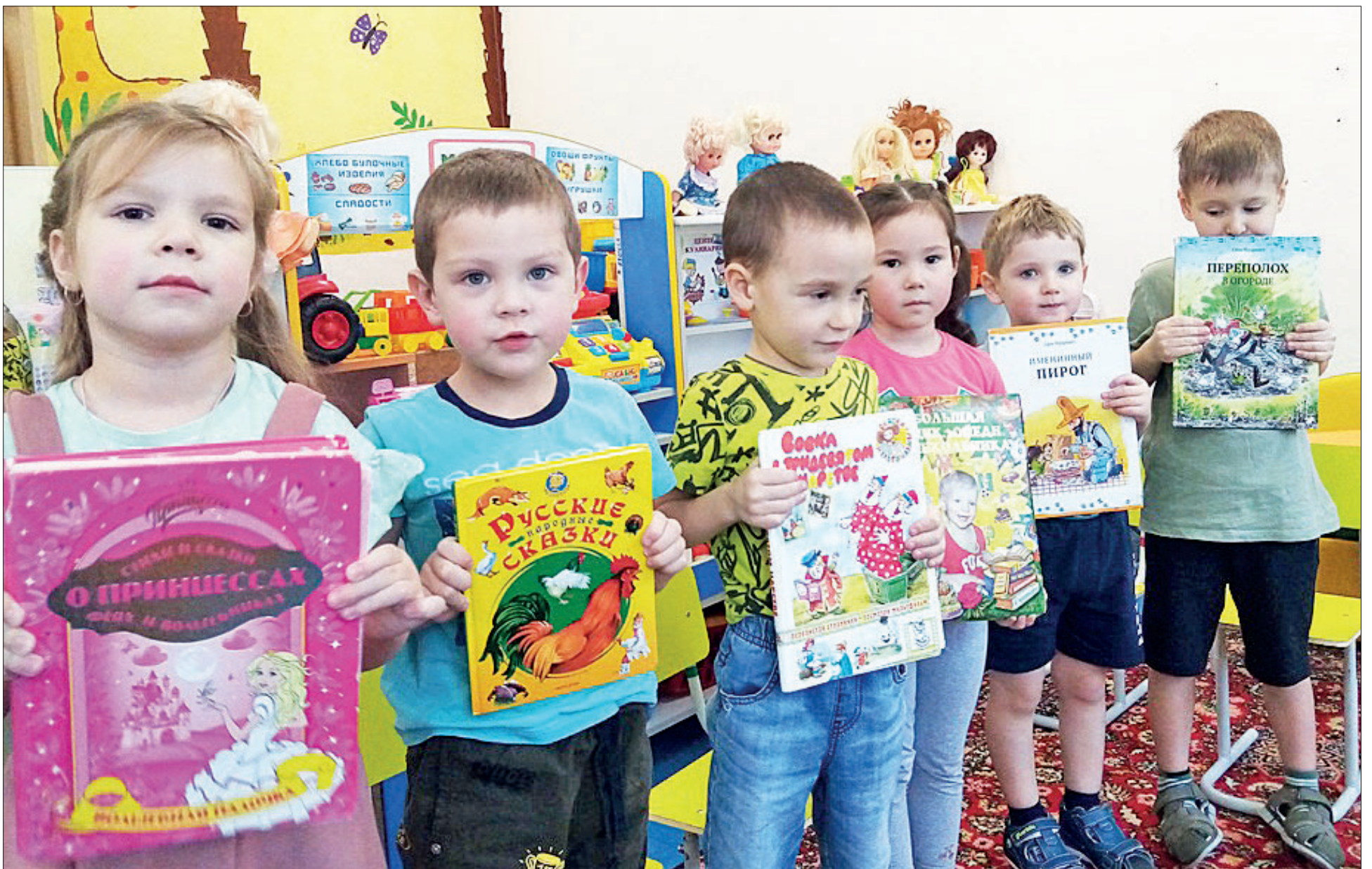
Мальши с радостью поделились сказками, энциклопедиями, раскрасками

Юные ванаварцы присоединились к всероссийской акции и вместе с родителями собрали книги для детей Донбасса / 5