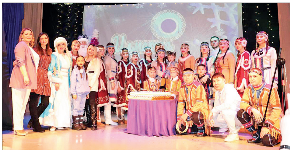
📷 Праздничный торт – в подарок юбилярам