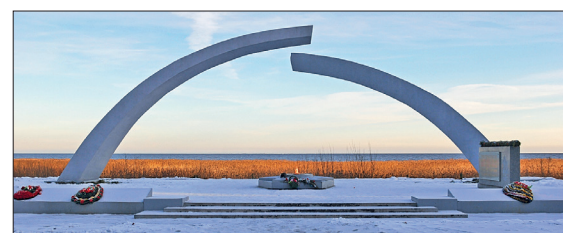
📍 Мемориал «Разорванное кольцо блокады Ленинграда»

■ 18 января наша страна отмечает одну из важнейших дат в истории Великой Отечественной войны – 80 лет со дня прорыва фашистской блокады легендарного Ленинграда.