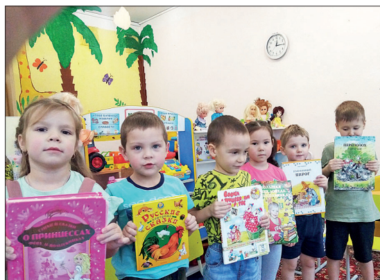
📷 Малыши с радостью поделились своими книжками

энциклопедиями, раскрасками. Никто не остался равнодушным!