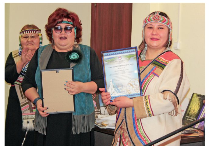
📷 Награждение победителей и организаторов

Материал подготовили: Наталья БОЯГИР, Ирина КОНЕВА, Мария ШАМОВА