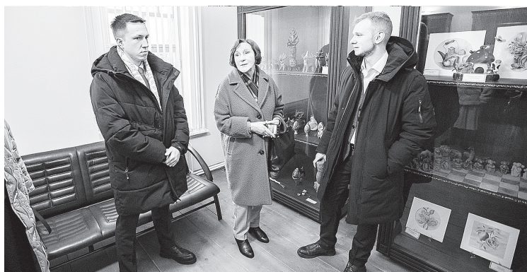
Депутаты ознакомились с экспозицией объекта культурного наследия «Летний дом архиепископа»

► Мы не должны забывать свои традиции, свои истоки. У нас в крае проживает более 160 национальностей, нам нужно сохранять культуру каждого народа, постигать ее, это позволит нам всем стать духовно богаче. По итогам заседания секции мы подготовим наши рекомендации по поддержке традиционной художественной культуры и ремесел в крае.