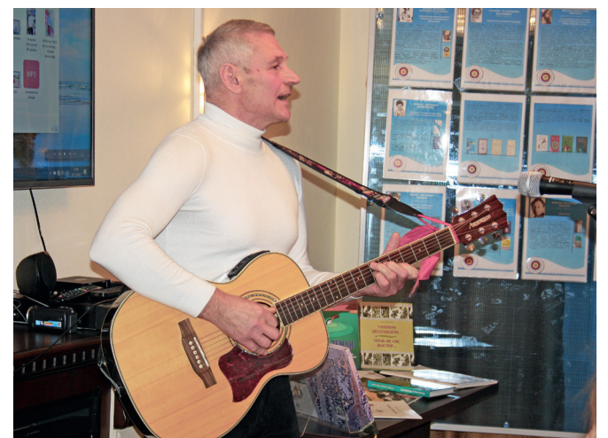
📷 Выступление гостей