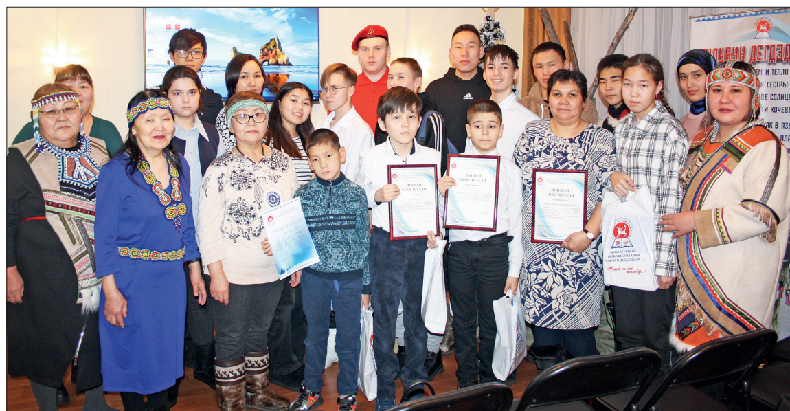
📷 Фото на память