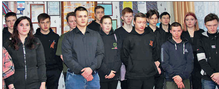
📍 На Уроке мужества