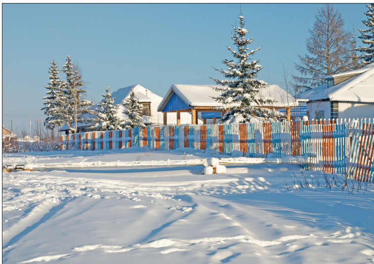
📷 Нидым ждет детскую площадку / ФОТО ИЗ АРХИВА РЕДАКЦИИ

■ Жители поселка Нидым приступили к подготовке проекта по реконструкции детской площадки, единственной в этом небольшом населенном пункте.