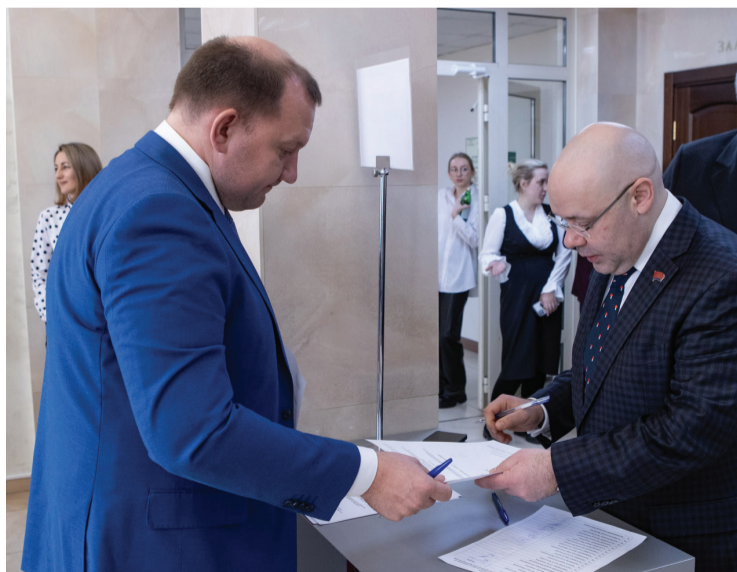
Кандидатура уполномоченного избирается тайным голосованием

– Россия испытывает сегодня высокое и гордое одиночество. Запад сам уничтожил свою веру в права человека, сделал ее дешевой разменной монетой в погоне за сиюминутной гео-