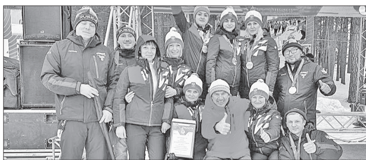
● Команда финансистов Эвенкии

Открывая спартакиаду, Владимир Бахарь отметил новый статус спортивных состязаний. «Спартакиада финансистов официально становится частью