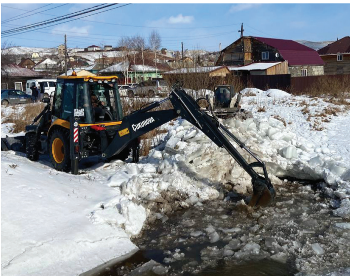
Параллельно с противопожарной в крае идет и противопаводковая подготовка

Параллельно с противопожарной идет и противопаводковая работа. В территориях, где возможны заторы, будут чернить и взрывать лед, организуют авиапатрулирование. Для ликвидации возможных ЧС создан запас материальных ресурсов. Его хранят на пяти складах вблизи Красноярска, а также в Минусинске, Енисейске, Северо-Енисейске, Богучанах, Ярцево, Зотино, Ворогово, Курагино и Балахте.