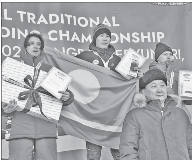
■ Первый Международный чемпионат по оленеводству собрал 130 человек

В рамках деловой программы форума прошли внеочередное заседание совета ассоциации «Оленеводы мира» и Международная конференция по вопросам развития домашнего оленеводства в условиях глобальных перемен в Арктике.