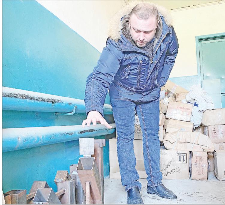
❷ Идет погрузка гуманитарной помощи