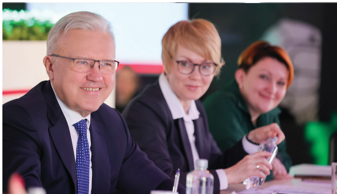
На встрече с губернатором общественники поделились своим опытом, рассказали о планах

О том, как в крае идет выполнение социальных проектов, руководитель края поговорил с лидерами некоммерческих организаций.