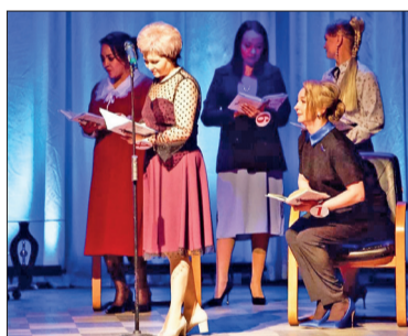
● Умение импровизировать – важное условие конкурса