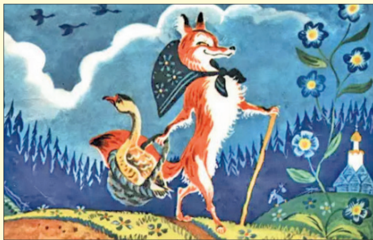
© Рыжая плутовка с добычей / РИСУНОК: АНАТОЛИЙ ЕЛИСЕЕВ

Ее пустили. Вот она легла сама на лавочку, хвостик под лавочку, скалочку под печку.