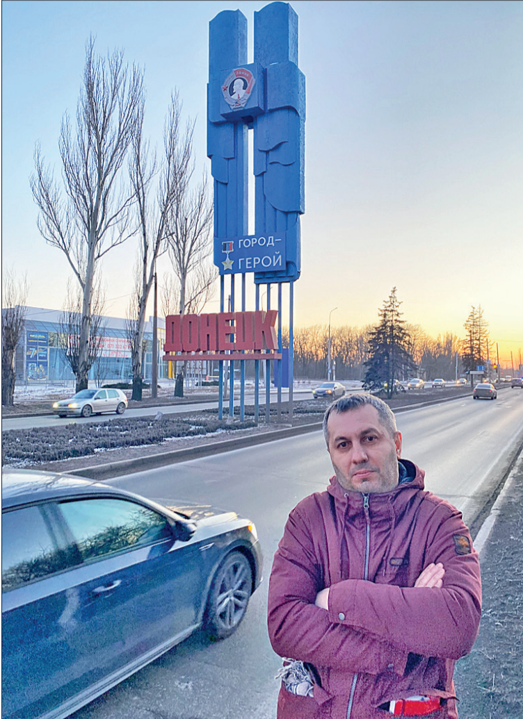
❶ Стела на въезде в Донецк, граница с Макеевкой