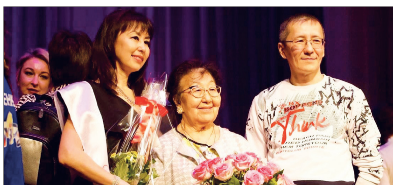
● Жюри отметило хорошую подготовку конкурсанток