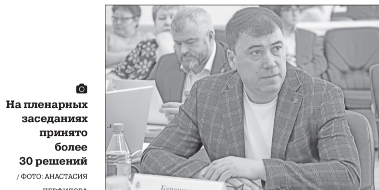
■ На пленарных заседаниях принято более 30 решений

и позволит экономичнее и результативнее использовать авиационный транспорт, задействованный для завоза на промысловые участки.