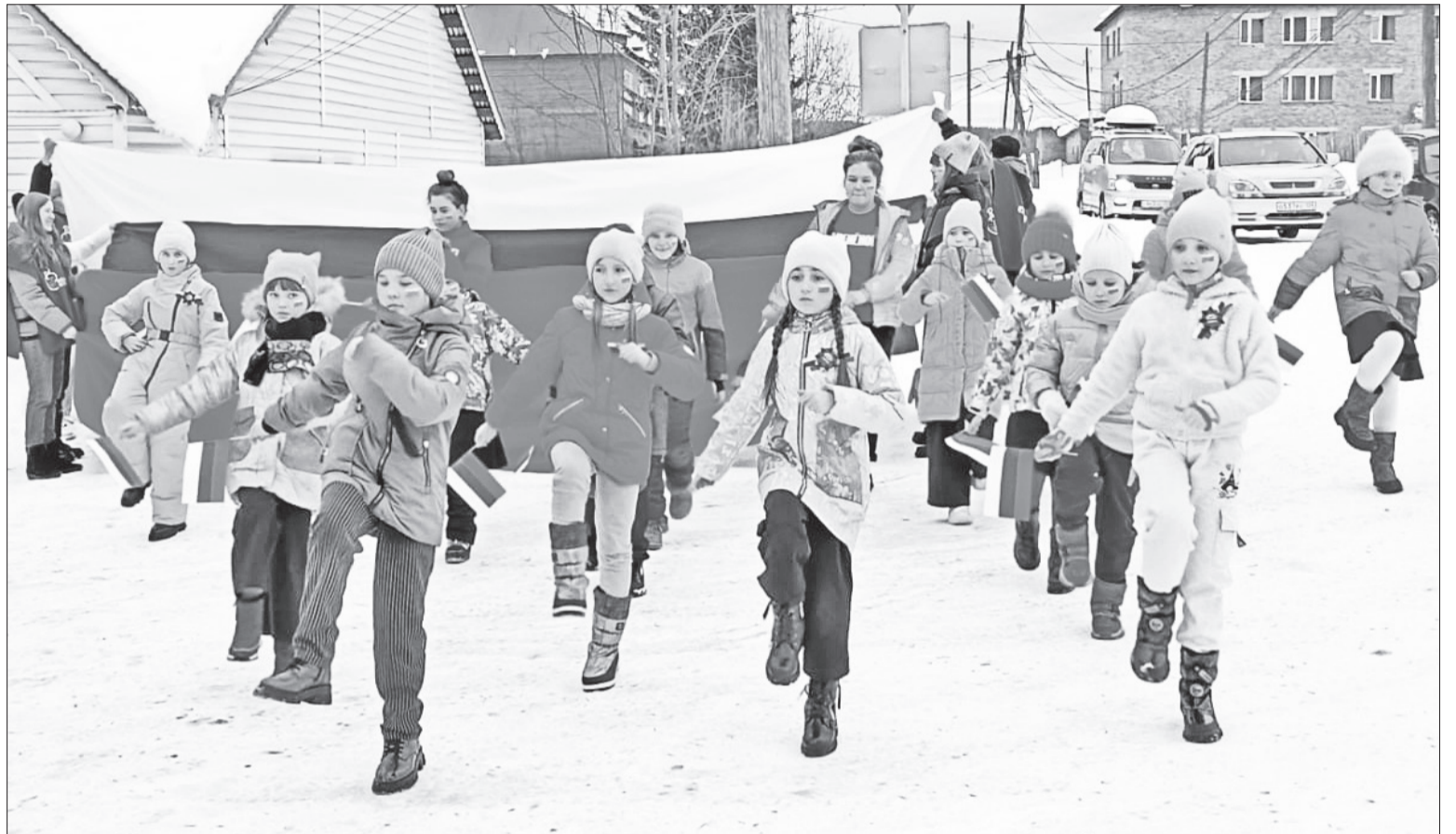
📷 Флешмоб с российским триколором в Байките

Библиотеки Эвенкии тоже не остались в стороне от всенародной акции. Практически в каждой оформлены обзорные книжно-иллюстративные выставки, информационные стенды, альманахи для учеников старших классов, организованы беседы и показы тематических презентаций. Посетители эвенкийских библиотек познакомились с красочными книгами, рассказывающими о богатейшей истории Крыма, природных достопримечательностях