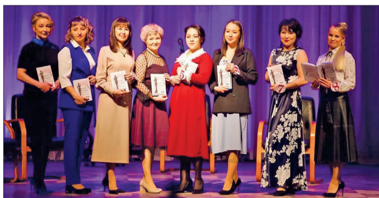
● Все участницы – педагоги, успешные в своей деятельности