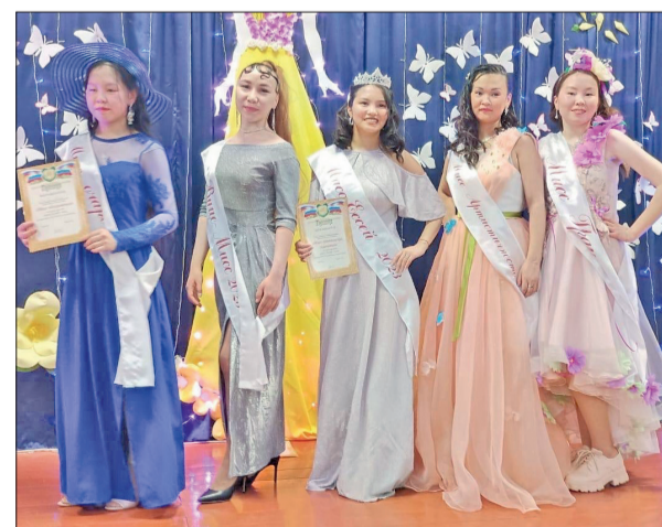
● Ессейские девушки достойно выступили на конкурсе

Спасибо всем девушкам за смелость и активность. Конкурс «Мисс Ессей – 2023» войдет красивой страницей в культурную историю Эвенкии.