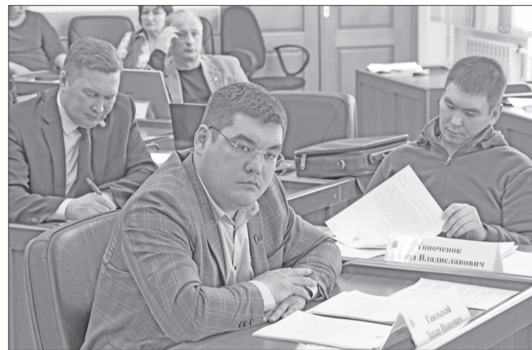
■ Все вопросы, вынесенные на мартовскую сессию, детально обсуждены на профильных комиссиях

Депутаты приняли решение выйти с законодательной инициативой о внесении изменений в статью 55 закона края «О социальной поддержке граждан, проживающих в ЭМР Красноярского края». Парламентарии предлагают более эффективно использовать услугу по авиадоставке охотников на промысловые участки: на обратном пути не отправлять авиаборт пустым, а разрешить производить вывоз оборудования (электрогенераторы, лодочные моторы, двигатели снегоходов и др.), принадлежащего промысловикам и нуждающегося в капитальном ремонте, а также заготовленной ими продукции традиционных видов хозяйствования и промыслов. Важно, что внесение этой поправки не потребует дополнительных бюджетных ассигнований, а лишь усилит логистическую систему