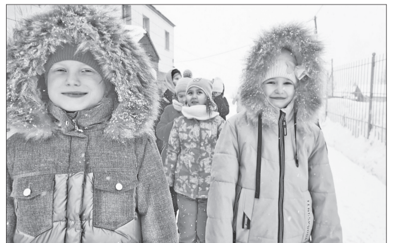
📷 Мы – за дружбу!

полуострова, интересных фактах из жизни республики после референдума. Образовательные учреждения также много внимания уделили исторической российской дате.