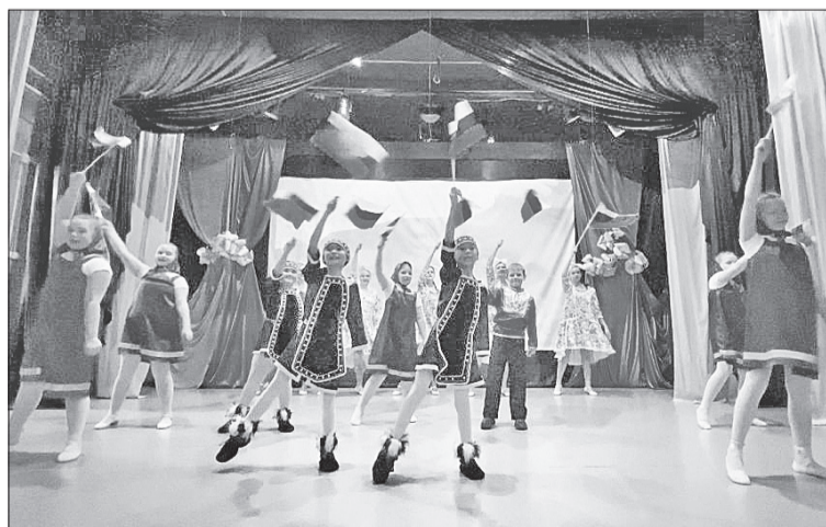
📷 На сцене Ванаварского дома культуры