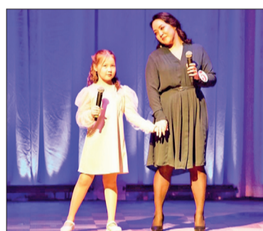
● Девушки были очень артистичными