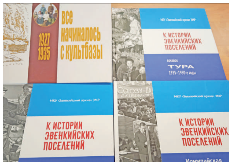
☉ Архивнаил документал книгалду

Книга «Эвенкийскаил поселениелдули улгурилтын. Илимпейской группа» том 1, том 2 источникилдук, архивнай материалилдук гавувча. Эвенкийской архив фондадукин документал 1920–1990 аннганили основан бисин. Таду улгучэвдерэн, он мутнги дуннэлдук – уриктилдук, нулгиктэкилдук факториял овчал, он хозяйственнаил централ колхозилтын угиривдечэтын. Нулгиктэдери население факториялду инилчэн, умунди коллективнай хозяйствавэ даявучадяна. Докумен-