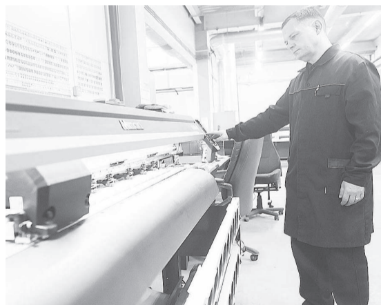
На промышленных площадках ТОСЭР Железногорск работают 12 компаний-резидентов