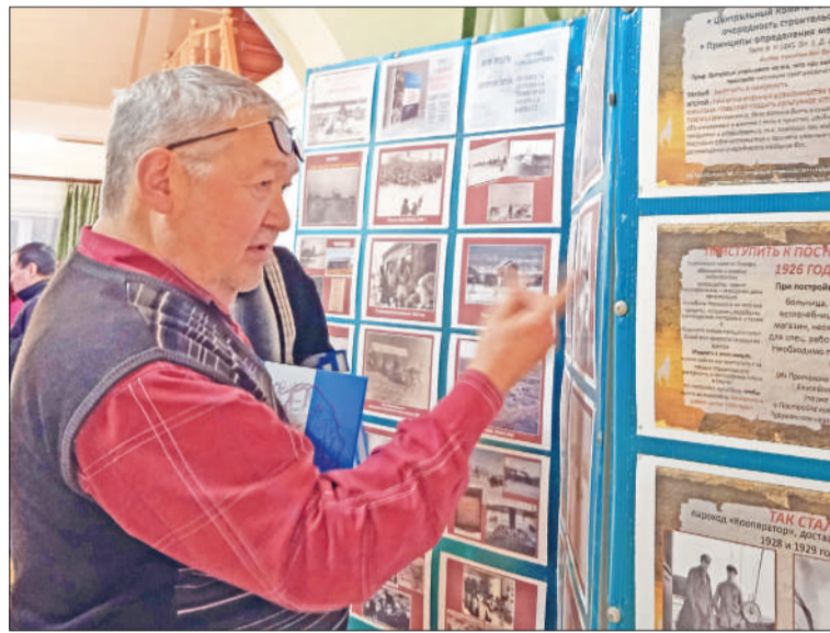
☉ Эвенкиянги ин стендалду