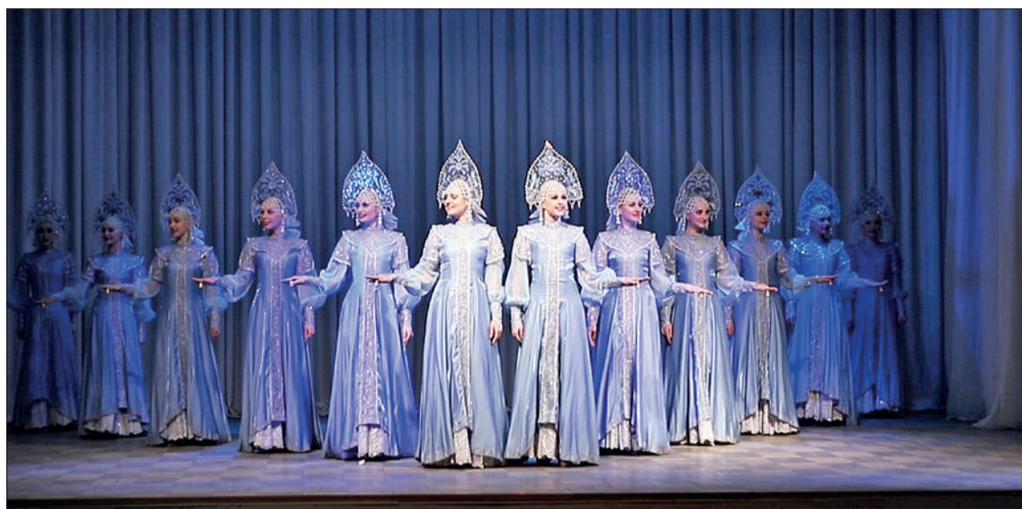
Ансамбль привез программу «Любимый край»