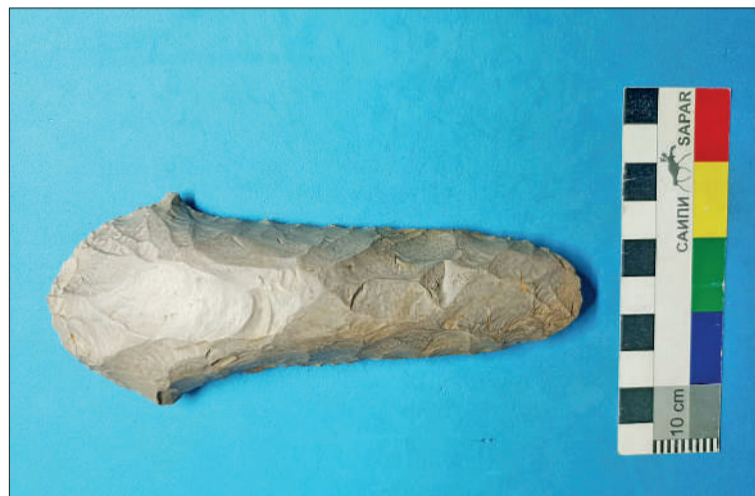
● Найденный топорик, как определили ученые, относится к эпохе неолита

Ранее на берегах Чуни геологами и археологами велись полевые работы, а также местные жители находили необычные предметы, включая фрагменты керамических сосудов и каменный инвентарь. На поверхности «чунской» гальки имеются небольшие углубления природного проис-