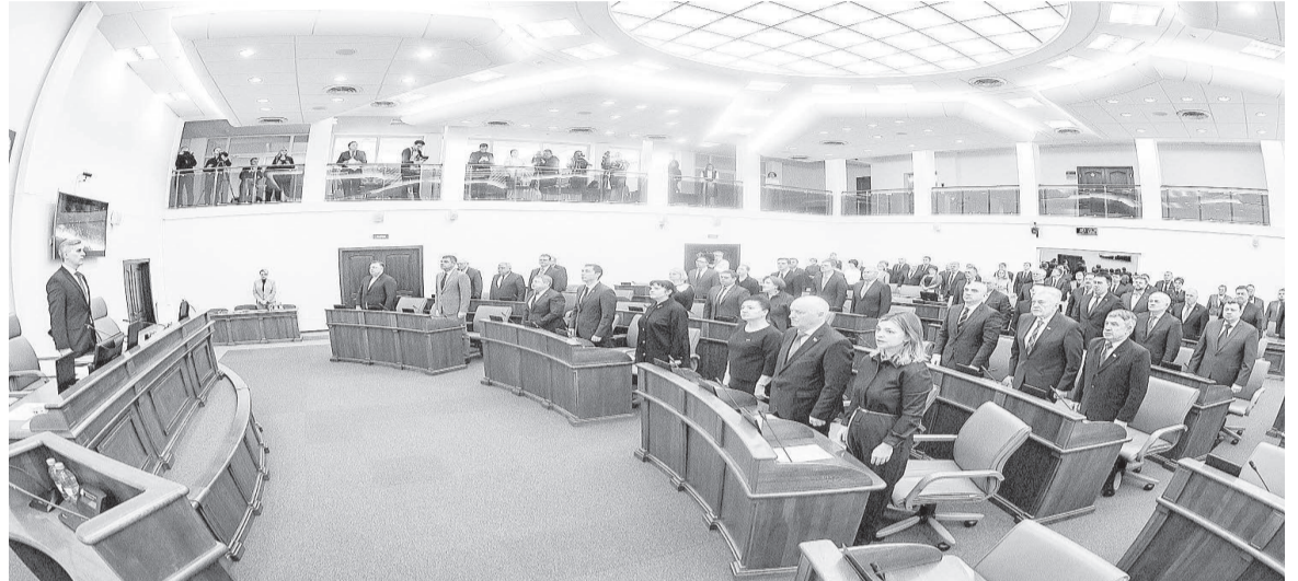
Исполнение гимна РФ перед началом сессии стало традицией

– Мы должны пройти свою часть пути, связанную с законодательным обеспечением процесса. Практика по приданию такого статуса у нас есть – при подготовке объектов универсиады. Это практика оправданная и соответствует уровню проекта и порядку его реализации.