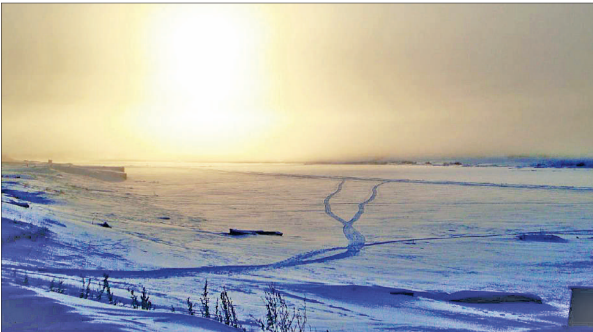
Морозный день на Подкаменной

Спасибо, что вы нас читаете. До встречи на следующей неделе! Больше информации – в соцсетях: