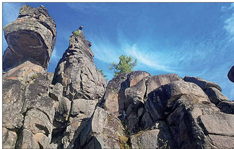
☉ Каменные великаны Суломай

Организаторы встречи познакомили гостей с уникальным социально-экологическим проектом «Мир каменных великанов», в рамках которого в мае текущего года планируется экспедиция в Эвенкию для изучения памятника природы – Суломайских столбов.