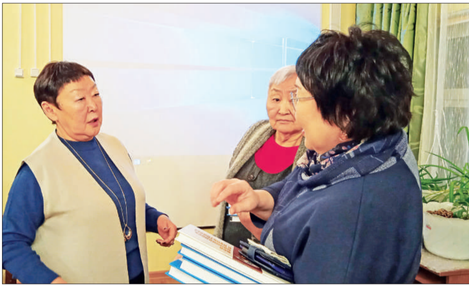
☉ Хангусал биси