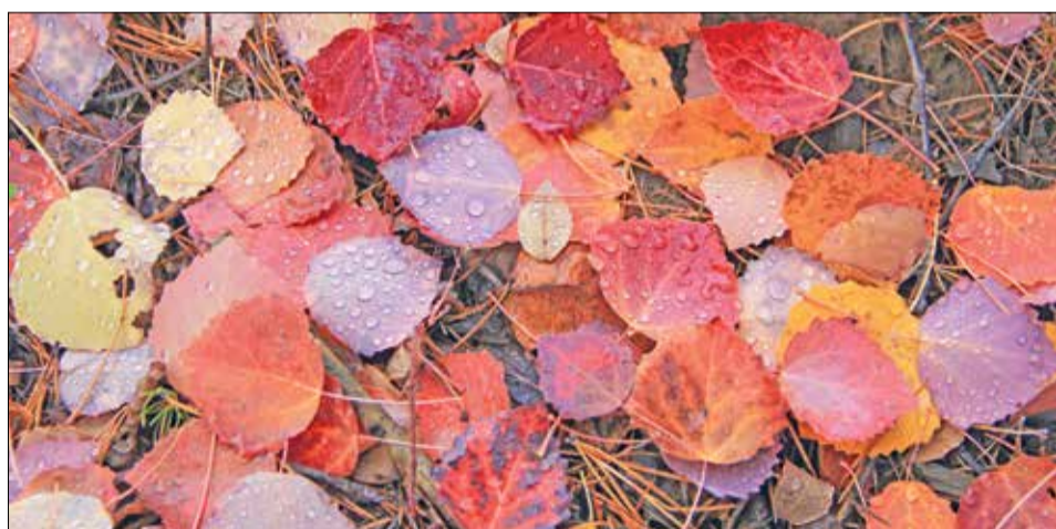
Осень во всей красе