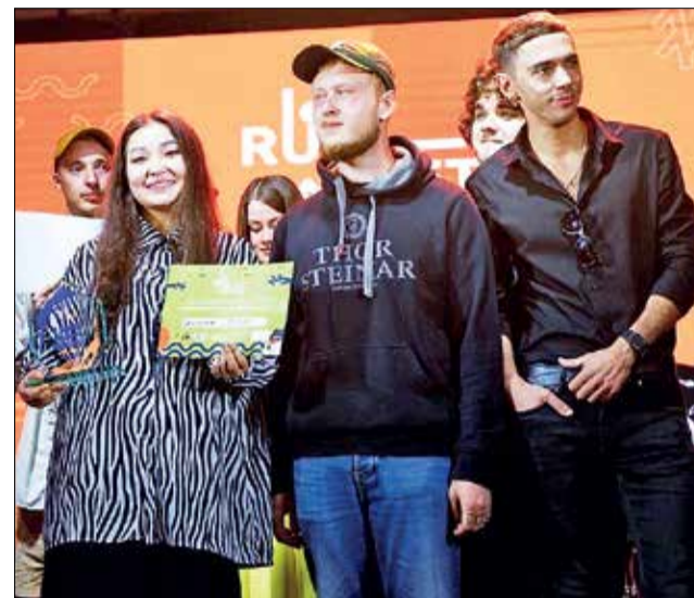
■ Жюри оценило уникальный стиль коллектива – современное этно

■ Группа AINA из Красноярского края вошла в число призеров международного конкурса этнической песни.