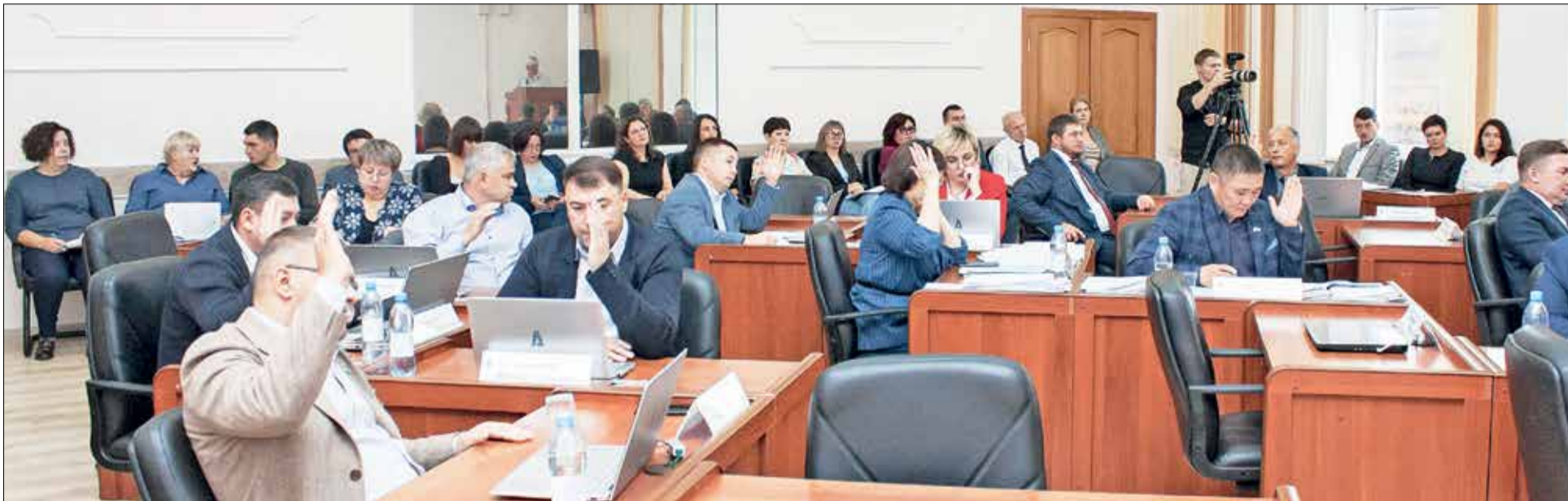
На контроле парламентариев самые актуальные вопросы жизнедеятельности района