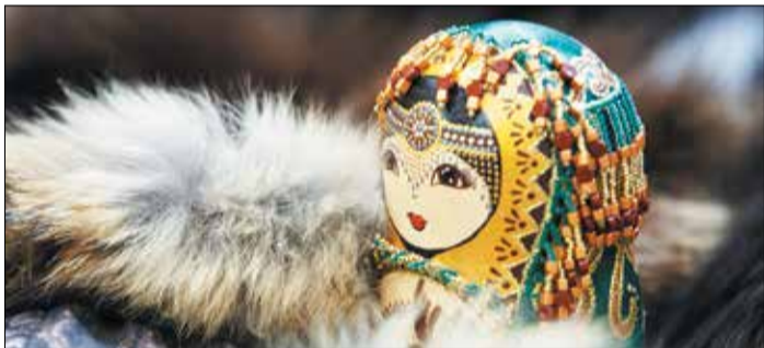
❶ Северное народное творчество

■ Состоялся очередной конкурс на предоставление субсидий предпринимателям, осуществляющим деятельность в области художественных ремесел на территории Красноярского края.