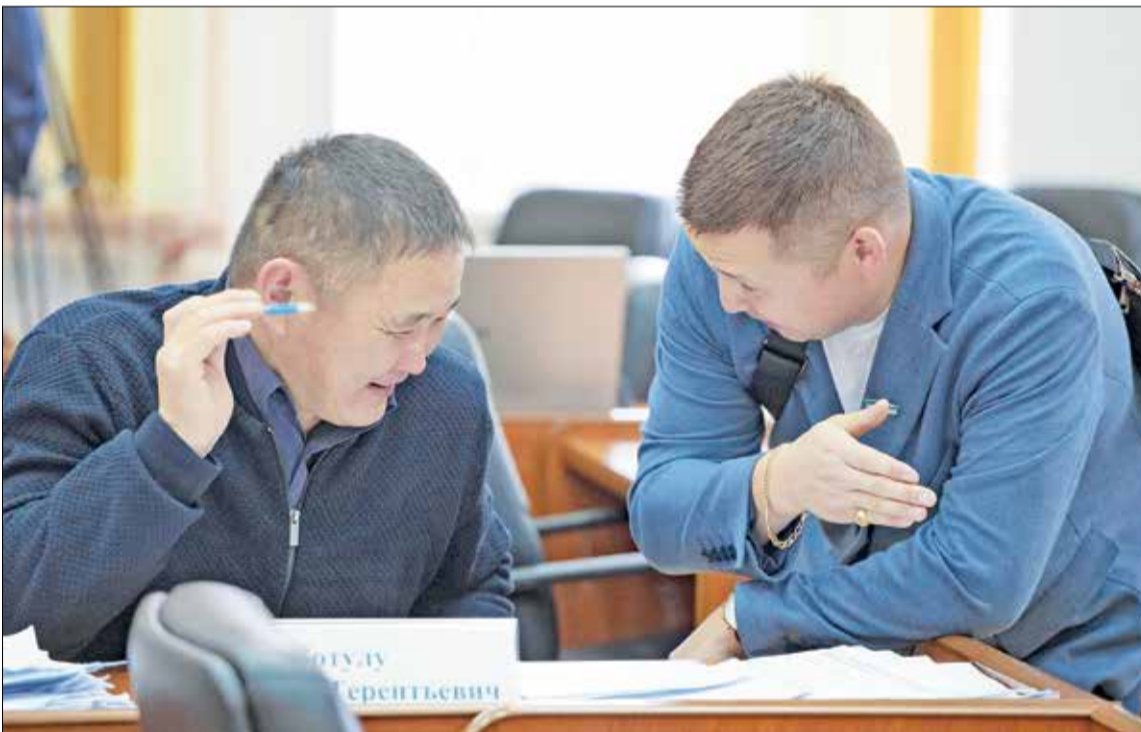
В следующий раз народные избранники соберутся в декабре – на XI сессию райсовета

чердачного покрытия. Ремонт запланирован и в Суриндинской школе. Как показало обследование спортзала, часть строительных конструкций не отвечает требованиям эксплуатации. В следующем году начнется первый этап ремонта. Для Суломайской школы приобретено модульное здание. А ванаварские школьники должны отметить новоселье в октябре-ноябре после приемки нового здания.