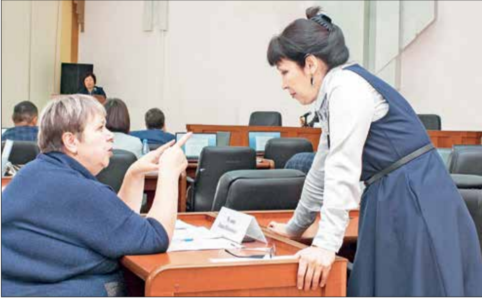
Контрольно-счетная палата ЭМР представила доклад о результатах проведенных финансовых проверок