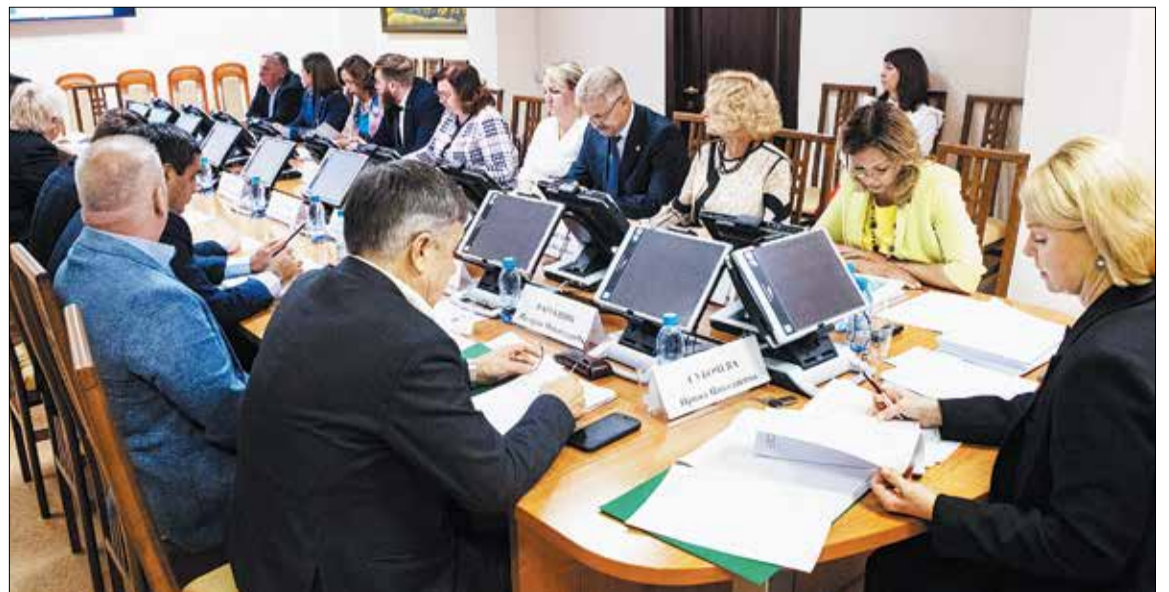
❷ Профильный комитет продолжает совершенствовать законодательство в сфере защиты прав ребенка