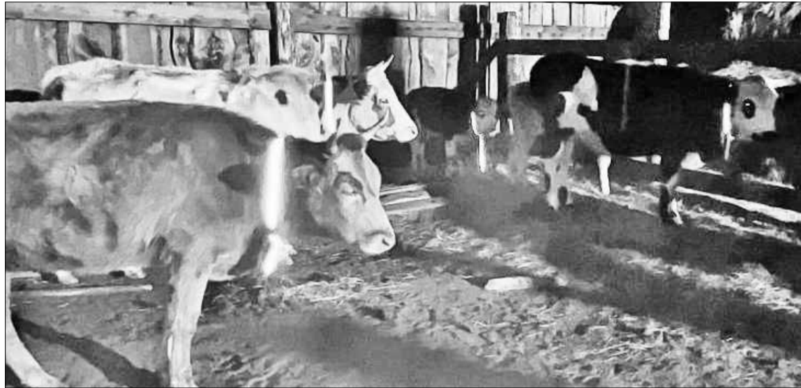
■ Ответственность за местонахождение сельскохозяйственных животных несут их владельцы

Полицейские призывают водителей и пешеходов быть очень внимательными, если в поле зрения появляется представитель КРС. А владельцы сельскохозяйственных животных должны понимать, что несут за них полную ответственность