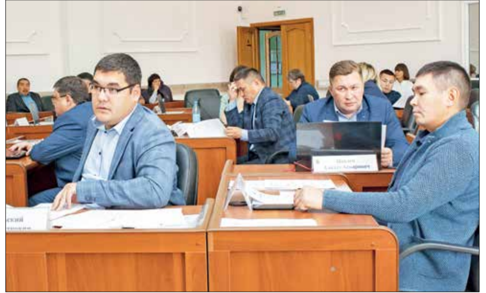
Финансово-хозяйственная деятельность оленеводческого предприятия «Суриндинский» вновь стала темой обсуждения на сессии