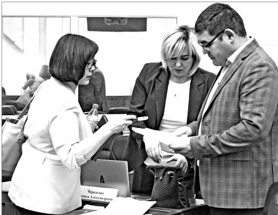
Слаженная работа депутатского корпуса позволяет принять правильное решение

В течение недели в Туру проходила X сессия Эвенкийского районного Совета депутатов пятого созыва. На пленарном заседании, состоявшемся 22 сентября, народные избранники приняли более 40 решений.