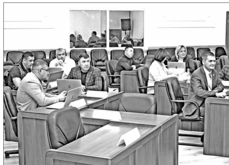
Парламентарии рассмотрели отчет об исполнении районного бюджета в первом полугодии 2023 года