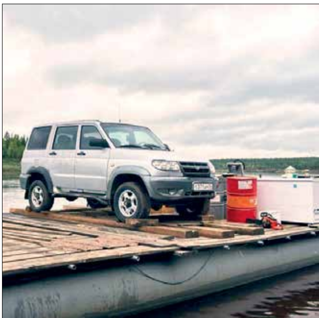
📷 Плоты – единственный способ отправки большегрузов летом из села