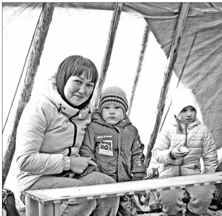
Гостей на празднике было очень много