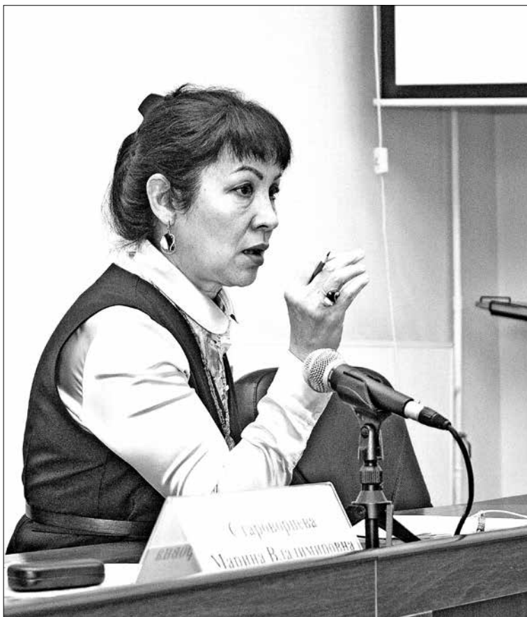
Каждую проблему народные избранники рассматривают точно