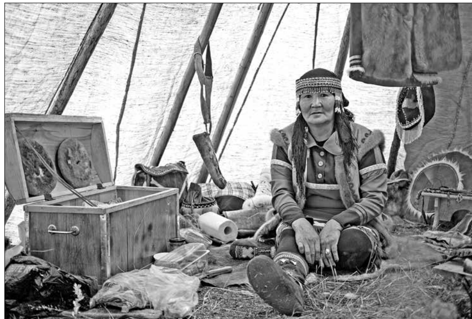
Красота по-эвенкийски

В Эвенкийском многопрофильном техникуме второй год подряд проходит мероприятие, приуроченное ко Дню среднего профессионального образования.