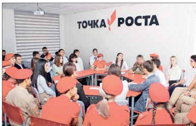
📷 Встреча прошла в приятной домашней обстановке