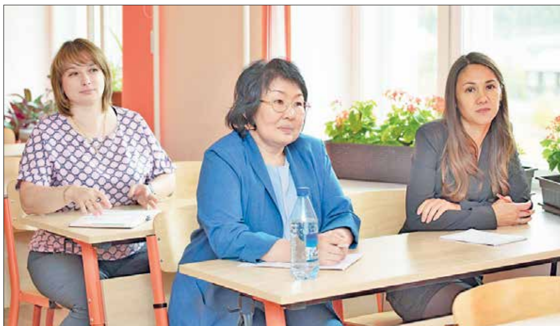
📷 Педсовет как одна из составляющих учебного процесса района

Подведены итоги работы по профориентации подростков, общественной деятельности и патриотическому воспитанию молодежи. В рамках региональных и районных проектов открываются новые спортивные клубы, школьные музеи, медиацентры, театральные студии. Активизации этого направления будет способствовать введение в российских школах должности советника директора по воспитанию