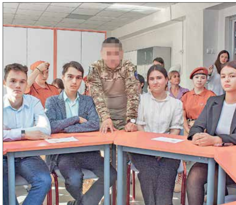
📷 Школьники с уважением встречают почетных гостей