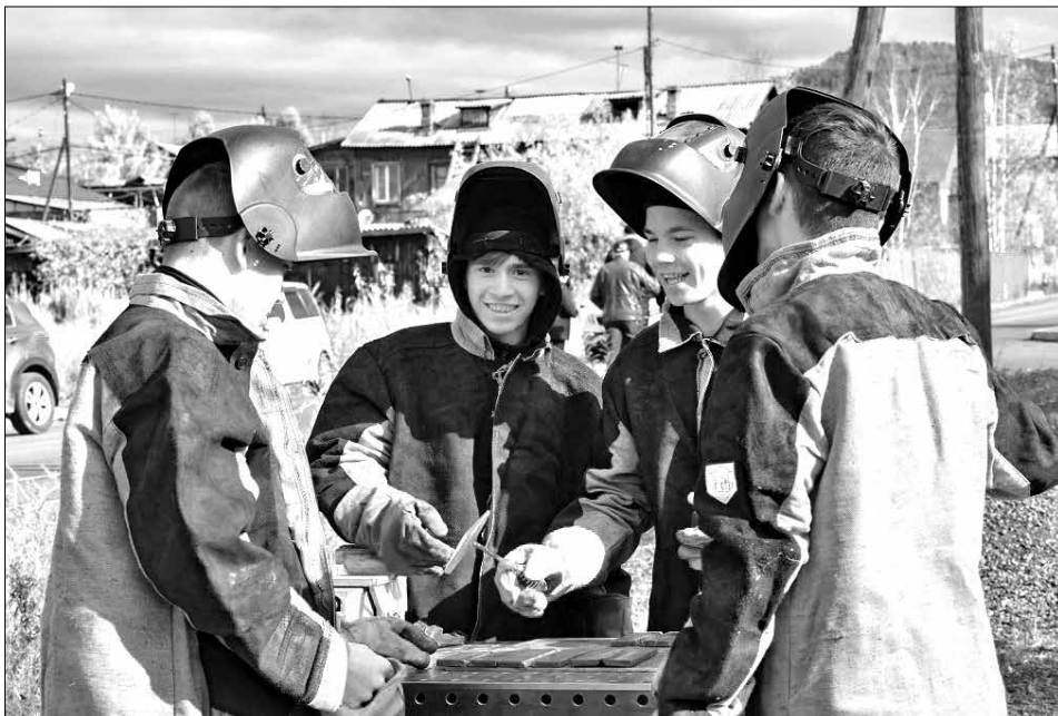
Юные сварщики работают с огоньком!