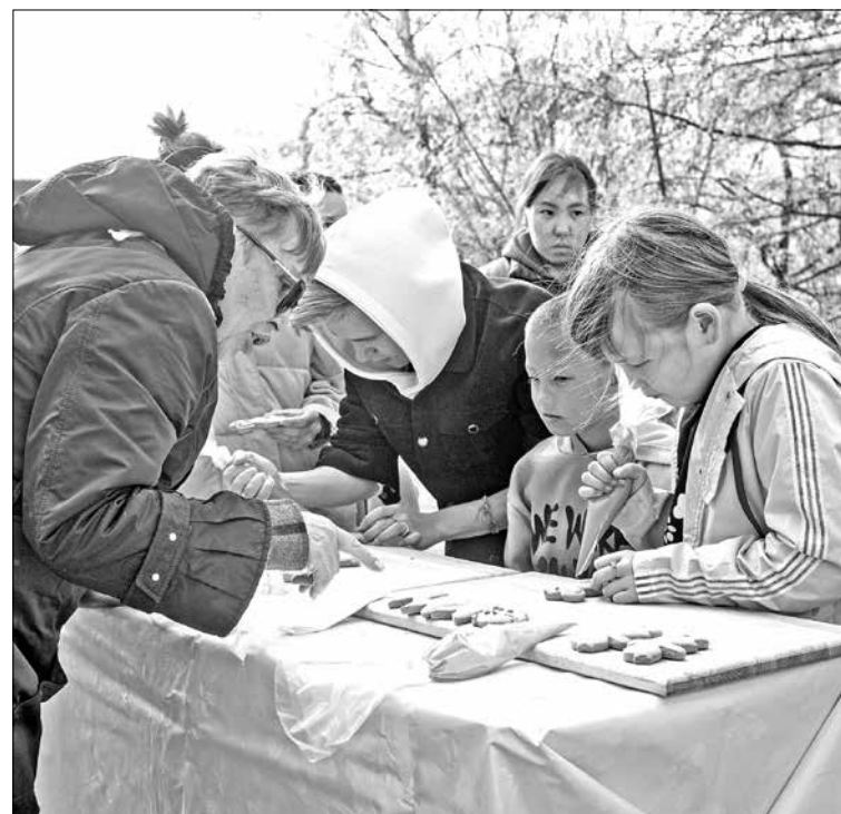
Гости активно участвовали в интересных мастер-классах