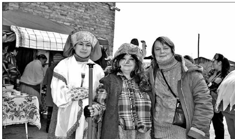
Колоритные персонажи сельских локаций