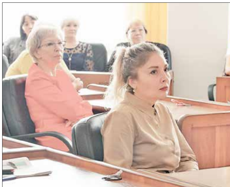
📷 Каждое учебное заведение старается соответствовать современным требованиям

и взаимодействию с детскими общественными объединениями. С 1 сентября такие специалисты начали работать в 5 учреждениях района.