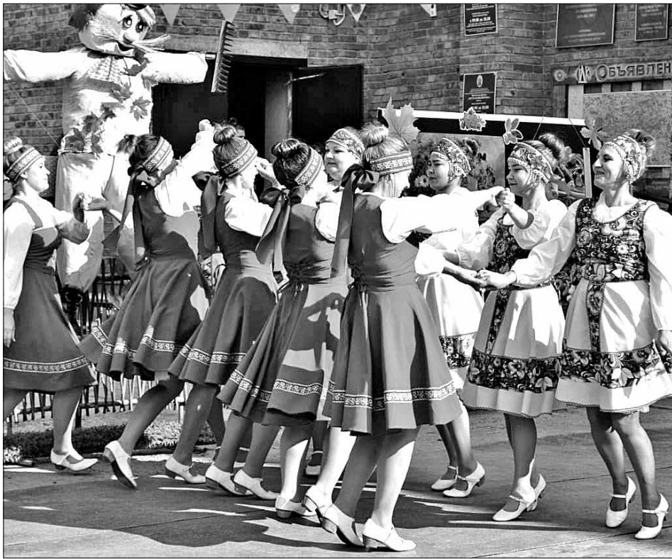
Яркий концерт подарил много радостных эмоций