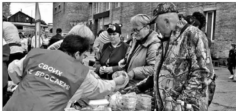
Волонтеры – активные участники общественных мероприятий

А теплая солнечная погода внесла в народное гуляние еще больше радости и оптимизма!