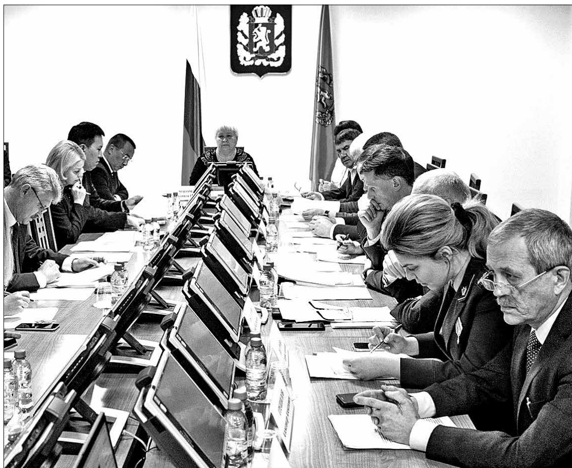
📷 В ближайшее время будут перераспределены полномочия органов власти в сфере доставки грузов на Крайний Север