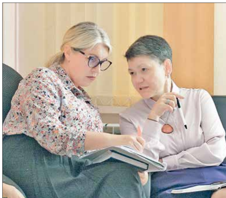
📷 Педагоги разных школ поделились опытом