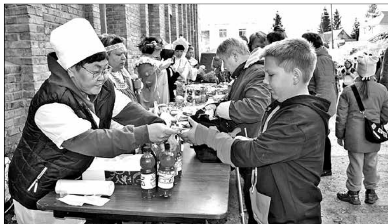
Было чем полакомиться на сельской ярмарке