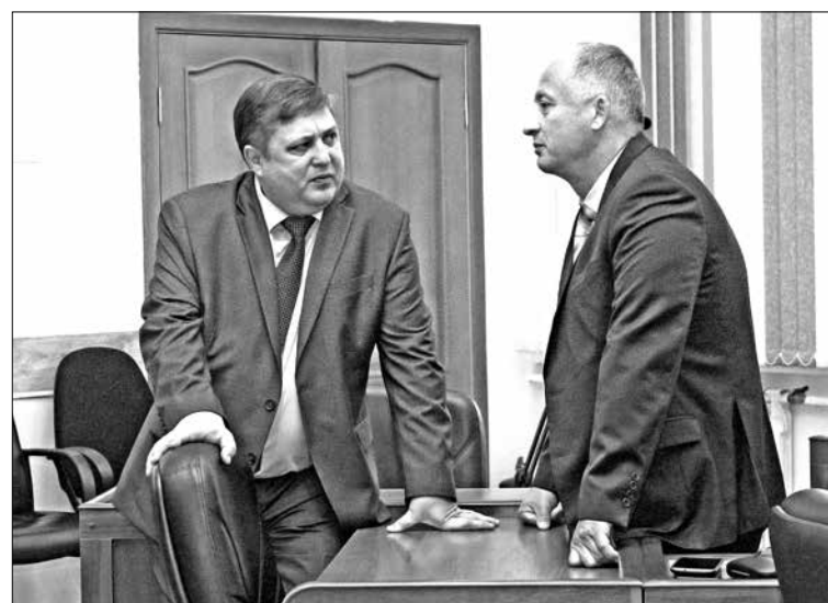
На каждой сессии обсуждаются важные вопросы местного значения