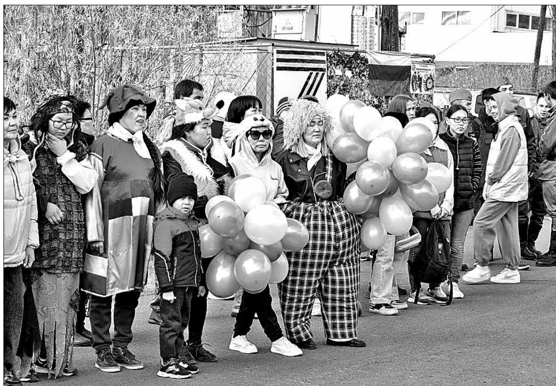
Коллектив техникума скрупулезно готовится ко всем своим мероприятиям