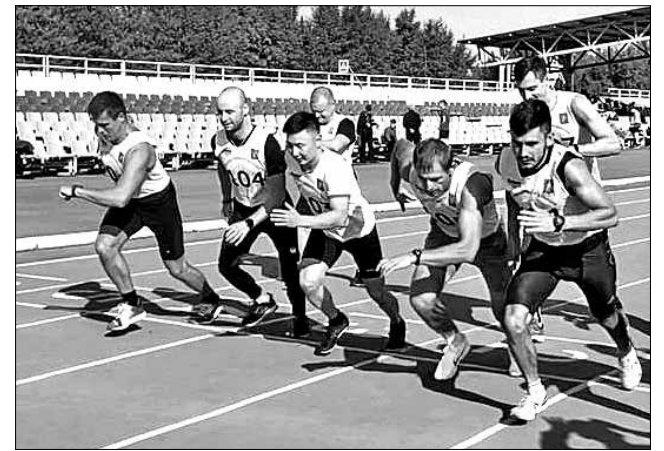
Бег – основной этап соревнований