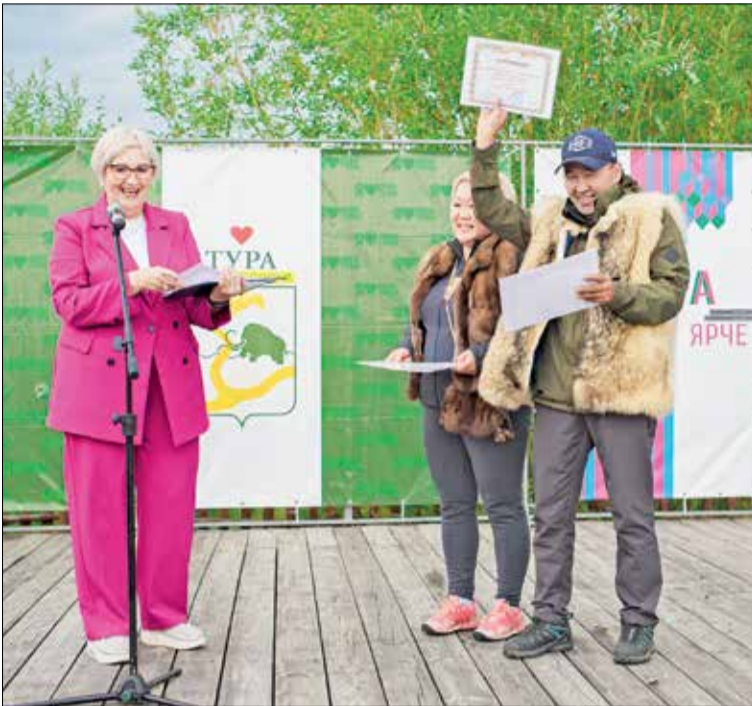
📷 Вручение сертификатов представителям родовых общин