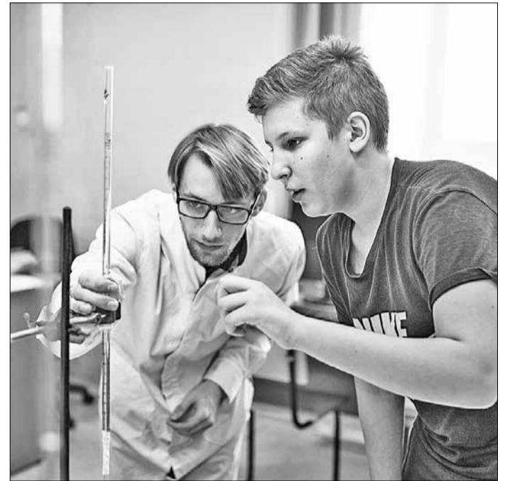
📷 Кем стать? Ключевой вопрос юности!