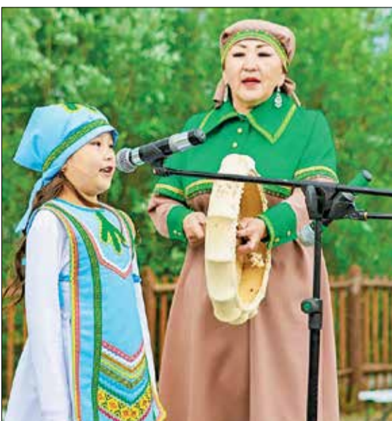
📷 Один из концертных номеров национального творчества