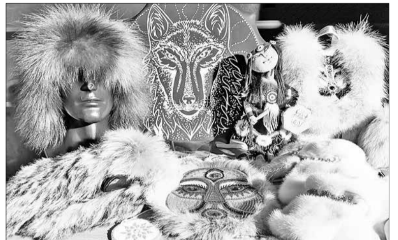
📷 Изделия ручной работы эвенкийских мастеров

Гостям продемонстрированы лучшие региональные бренды, в том числе продукция компании из Эвенкии Far-Fur Evenkia, которая производит уникальные изделия ручной работы – сувениры, одежду и обувь из натурального меха, верхнюю одежду, аксессуары, предметы интерьера.