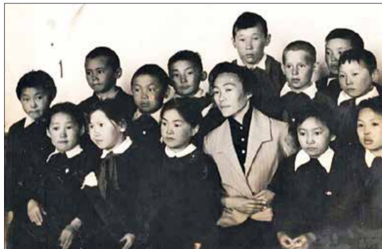
📷 Сучениками в Ессее, 1961 г.