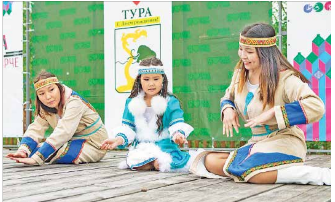
📷 Нежный танец юных туринок