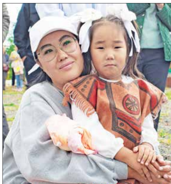
📷 На День аборигена приходят семьями