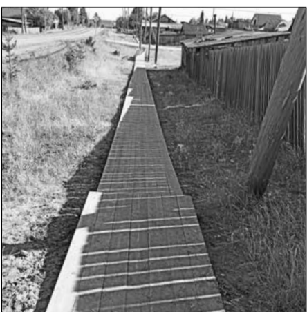
📷 Каждый год в Ванаваре новые тротуары