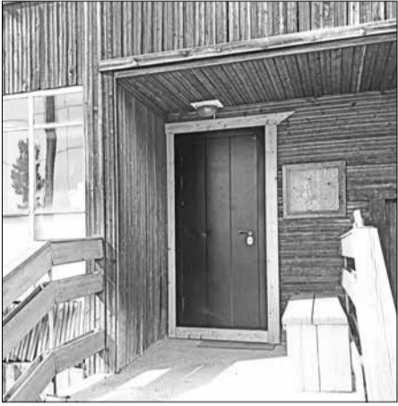
📷 Добротные двери – залог тепла и безопасности