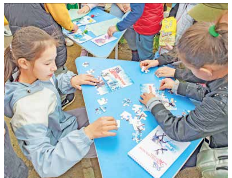
📷 Викторина от редакции ЭЖ / ФОТО: КСЕНИЯ КУЗЬМИНА