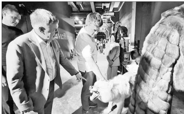
📷 Руководитель региона Михаил Котюков оценил продукцию творческих предпринимателей

■ В Красноярске состоялась встреча помощника президента России Максима Орешкина, руководителя Красноярского края Михаила Котюкова и бизнесмена Олега Дерипаски с предпринимателями края. Мероприятие прошло на площадке Сибирского института развития креативных индустрий.