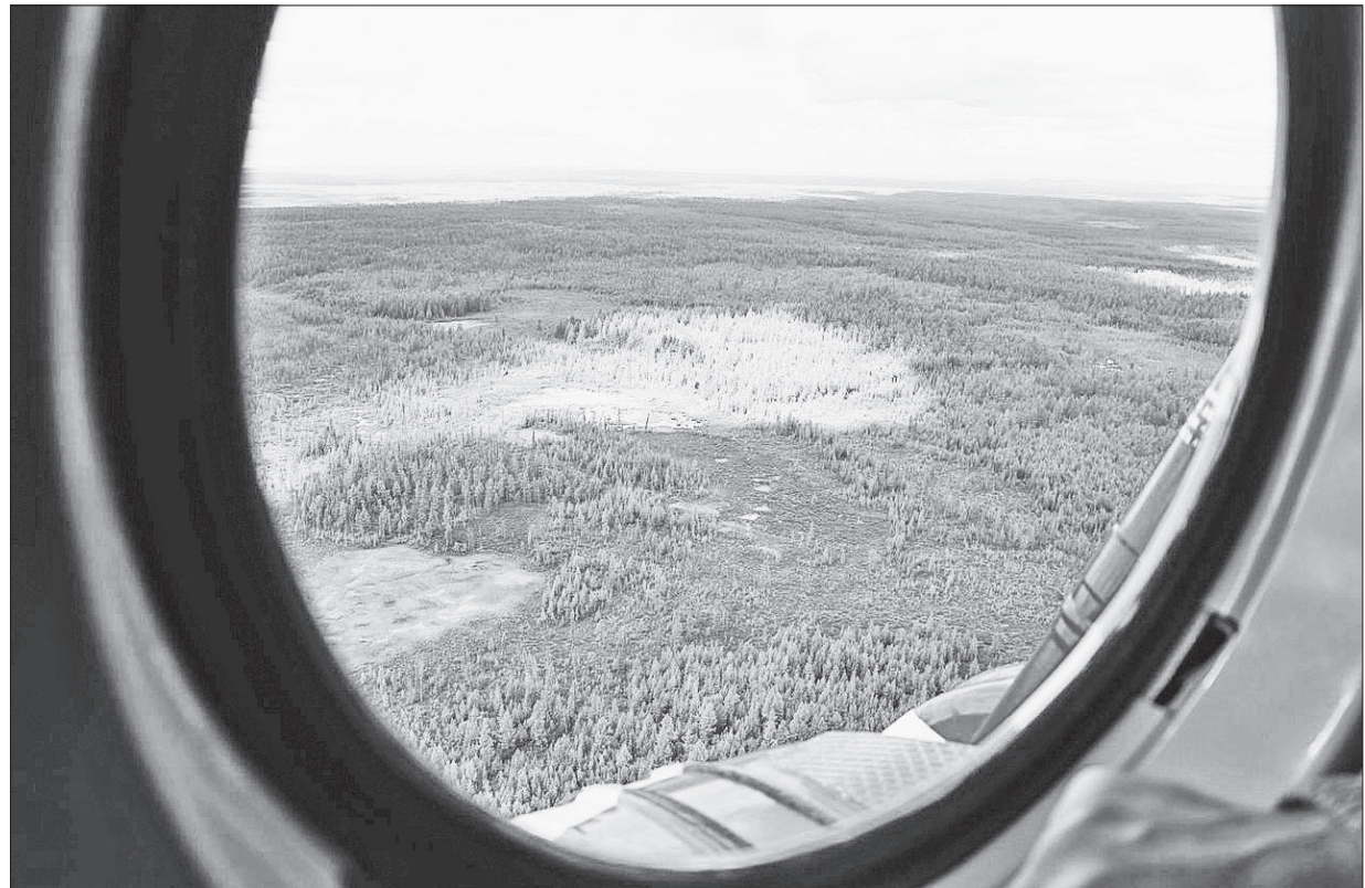
📷 Неразгаданный феномен