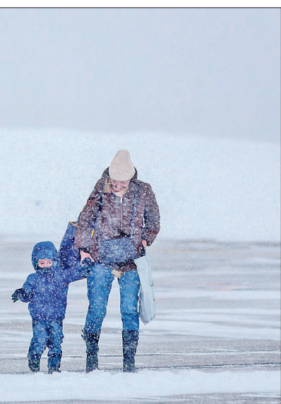
... Красноярск – Тура – Красноярск расход топлива составляет примерно 24/26 составляет примерно 3 тонны. (на Ан-26 – 5,5 тонны)

– Да о нем у нас, скажем прямо, никто особо и не помышляет. Любые расчеты, которые вы можете сделать совершенно самостоятельно, без нашей помощи, вам покажут: чтобы мы работали хотя бы в ноль, тарифы должны быть почти вдвое выше (рис. 2).