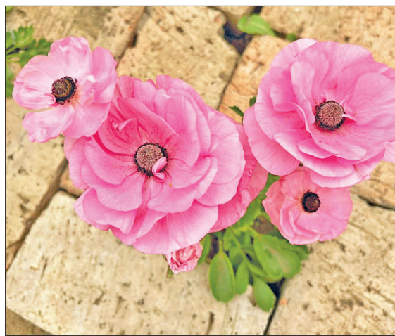
📷 Цветочные клумбы – главное украшение двора

перцы, огурдыня, многолетние цветы и «паданки» – и ни одного сорняка!