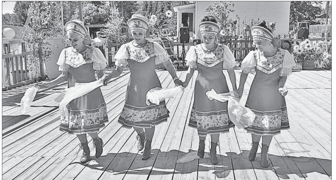
📷 Танцуют девчонки из Байкита