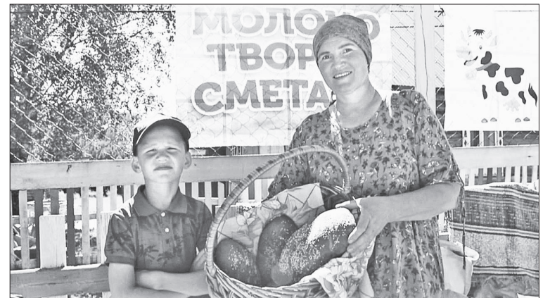
📷 Гостеприимные жители поселка Бурный