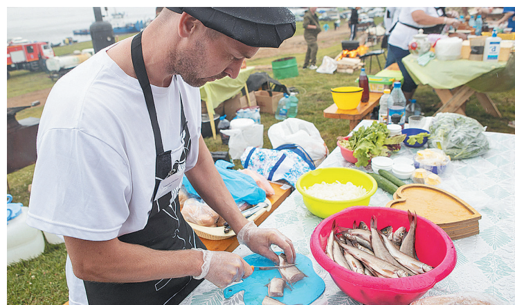
Для привлечения туристов в крае должно быть как можно больше таких точек притяжения, как фестиваль «Енисейская уха»

В Енисейске прошло рабочее совещание комитета по природным ресурсам и экологии, где обсуждались вопросы рыболовства и рыборазведения с участием представителей краевых министерств и научного сообщества.