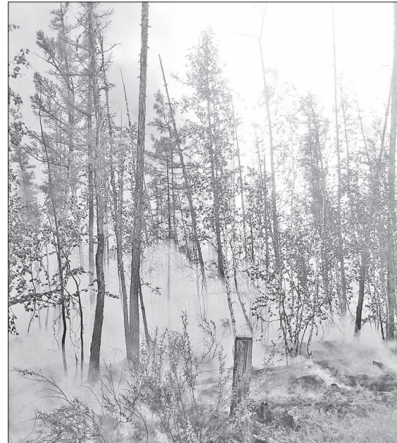
Борьба с возгоранием потребовала дополнительных ресурсов

Населенным пунктам огонь не угрожал. До ближайшего поселка Стрелка-Чуна расстояние составляло 225 километров.