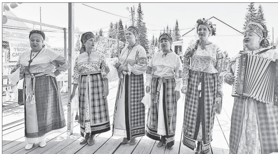
📷 Бурненцев приехали поздравить творческие коллективы Байкитской группы поселений

менной Тунгуске, там же закупали в магазине продовольствие, промышленные товары. Жители поселка снабжали Суломой и Байкит сельскохозяйственной продукцией, мясом, рыбой, дикоросами. Только в 1959 году, после большого наводнения, в Бурном открылись магазин, школа и заготовительный пункт, в 1961-м появился ФАП, в 1963-м открылась почта. В это же время здесь был организован производственный участок от Бай-