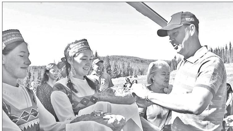
📷 Почетных гостей встречали у вертолета хлебом-солью

Бурненцы сдавали пушнину в заготпункт Большого порога (перевалочная база) на Подка-