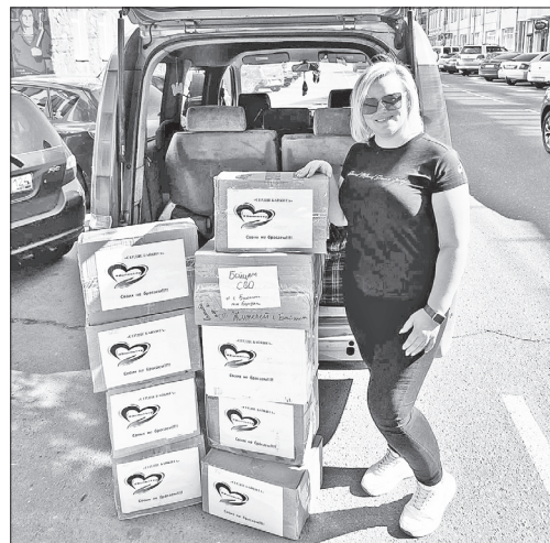
Отправка посылок в зону СВО