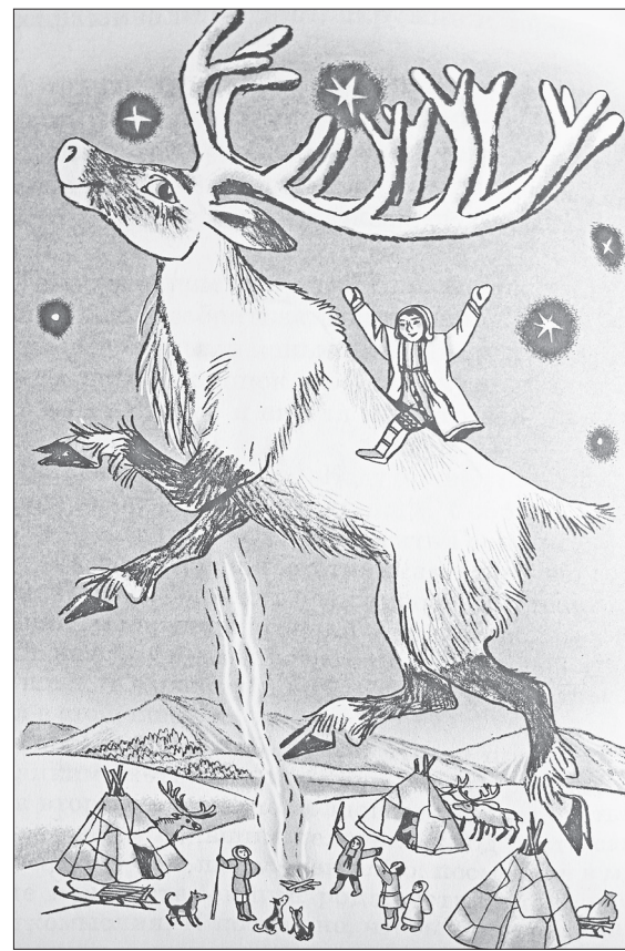
Дальне-восточнаил аборигенил улгурилтын

рэн. Оёдук уриикитви ичэрэн. Илэл нунганман арчара. Сокатчана Горпаньди юрэн. Оронкоунин дуннэвэ уриллэн, амутту мувэ упкатва умдан. Дуннэ сангаргача, му ачин оча. Сагды бэе гунэн: «Эрувэ эр дуннэлэ эмэвунни, оронми мерэт мучукал. Этэкэл сокатчами». Нян оронин хулукун оча. Горпаньди тэли этэрэн сокатчами, дуннэ урэмэ очан. Эру суручэ, сингкэн уриикитт лан эмэчэн.