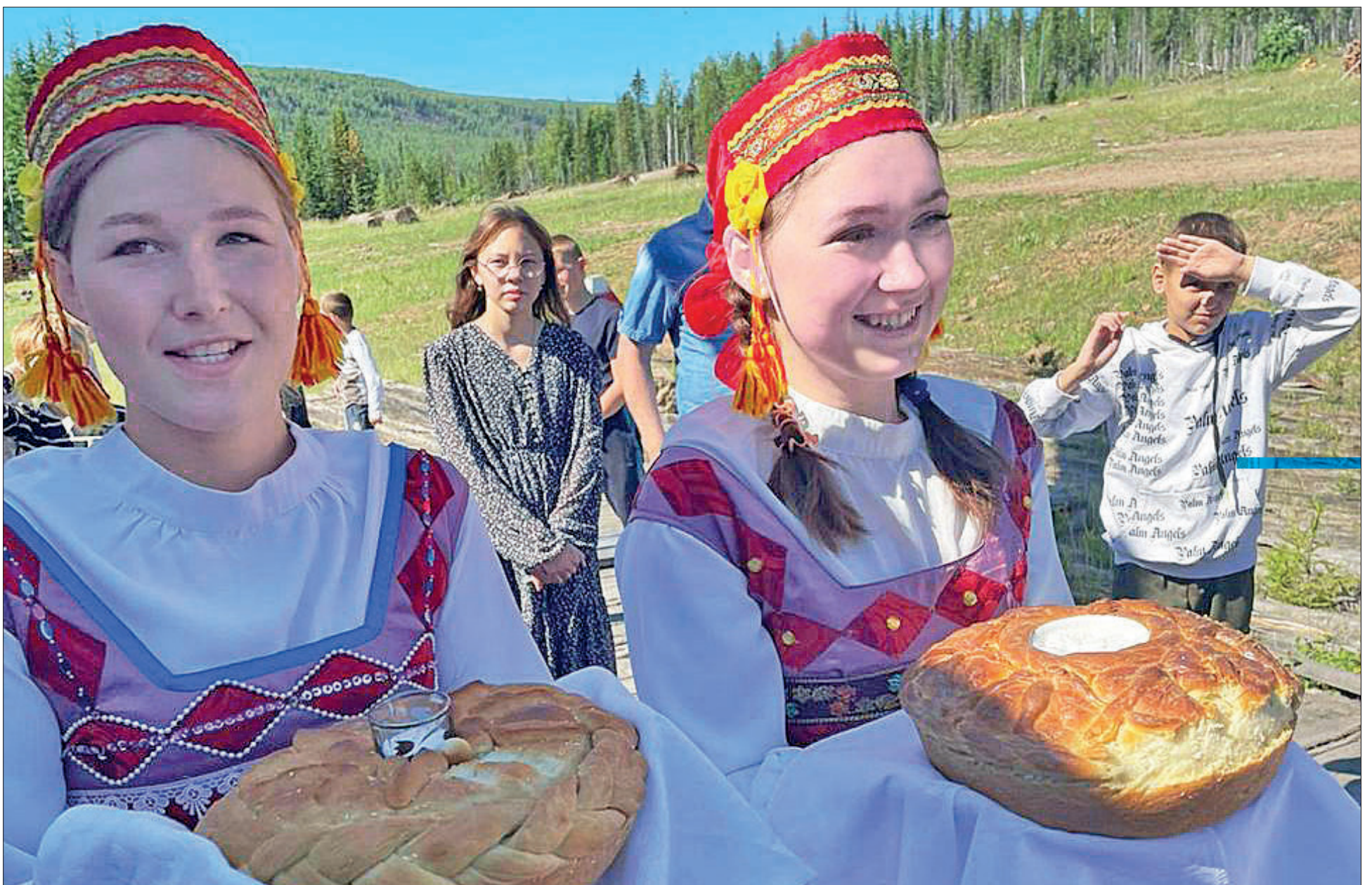
Почетных гостей из райцентра очаровательные бурненские девушки встречали хлебом-солью

Торжественная часть состоялась в ДК, а затем праздник продолжился в центре села за щедро накрытыми столами / 3