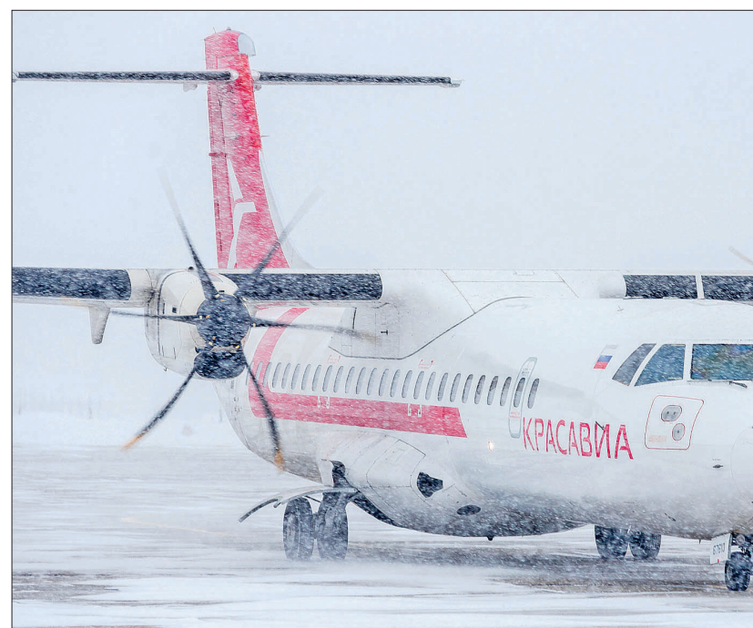
Стоимость запасных частей на ATR после санкций выросла в 2,8 раза