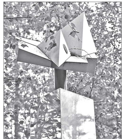
📷 Стела на заимке Кулика

После первых соревнований ребята из команды (четверо американских