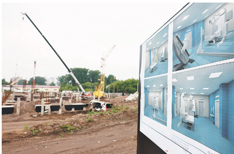
Строительство поликлиники в микрорайоне Пашенный. Ее очень ждут жители Свердловского района Красноярска

В 8-этажном здании разместятся инфекционное, рентгенологическое, акушерско-гинекологическое отделения, дневной стационар, центр амбулаторной хирургии и хирургический блок. Пациентов будут принимать терапевты, узкие специалисты, стоматологи и физиотерапевты. Прикрепиться к поликлинике по месту жительства и получить помощь смогут около 50 тысяч человек. Сдать больницу в эксплуатацию должны в декабре 2024 года.