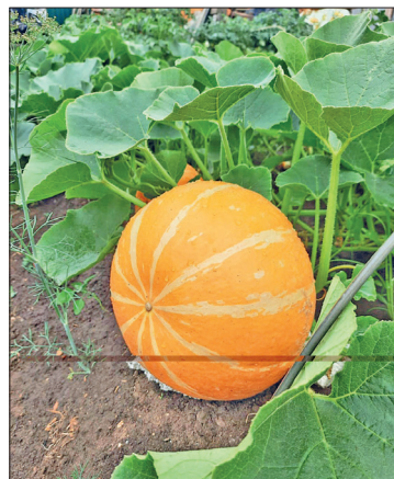
📷 Северные тыквы – просто объедаенье

не так давно увлеклись разведением кустарников и плодовых деревьев. Во дворе растет крыжовник «консул», имеющий высокие вкусовые качества, и в этом году должен порадовать хозяев обилием ягод. Более специфичны способы выращивания ранетки, облепихи, яблони. По словам Ольги, за этими культурами ухаживает супруг. Сажены закупают в питомниках.