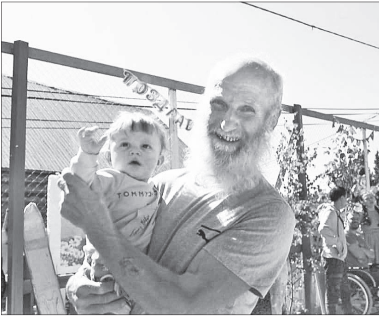
📷 Праздничное настроение