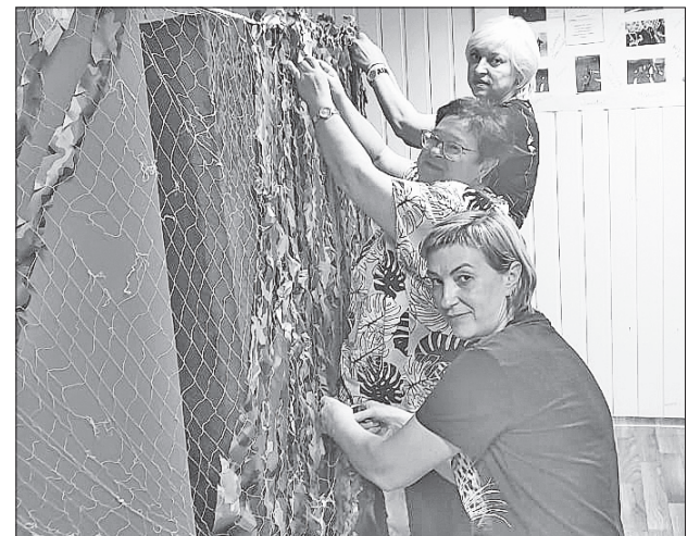
Готова очередная маскировочная сетка