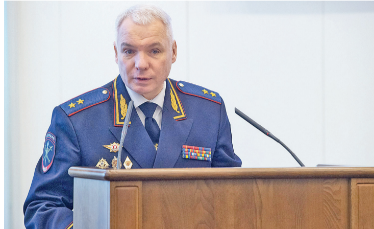
Начальник ГУ МВД России по Красноярскому краю рассказал об итогах работы в 2022 году