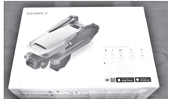
📷 Техническое устройство от сотрудников СМИ отправлено в зону СВО

■ Наша редакция приняла участие в приобретении спецтехники для российских защитников, участвующих в военной спецоперации.