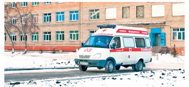
Онкозаболевания – приоритетное направление в здравоохранении

Тема лекарственного обеспечения пациентов с онкологическими заболеваниями находится под постоянным контролем комитета. Одно из направлений – таблетированная химиотерапия – лекарства, которые пациенты получают в амбулаторных условиях. Долгие годы эта форма лечения оплачивалась из средств Фонда обязательного медицинского страхования, но последние два года позиция ФОМС изменилась, что привело к постоянным штрафам для краевого онкоцентра.