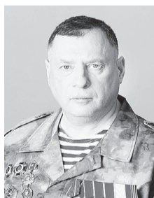
Юрий ШВЫТКИН , депутат Государственной думы Федерального собрания РФ:

Но самое, пожалуй, главное – это то, что Россия, несмотря на продолжение СВО, уже защитила более 6 миллионов человек, которые связывают свое будущее с нашей страной. На освобожденных территориях налаживается мирная жизнь, с помощью наших специалистов (в том числе из Красноярского края) практически заново отстраиваются многие поселки и целые города Донбасса.