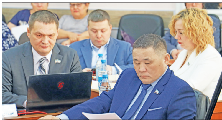
■ Одна из наиболее острых тем комиссии КМНС – судьба оленеводческого хозяйства «Суриндинский»

На контроле депутатов – проработка вопроса о возможности установления льготного тарифа на электроэнергию для субъектов малого и среднего предпринимательства, сопоставимого