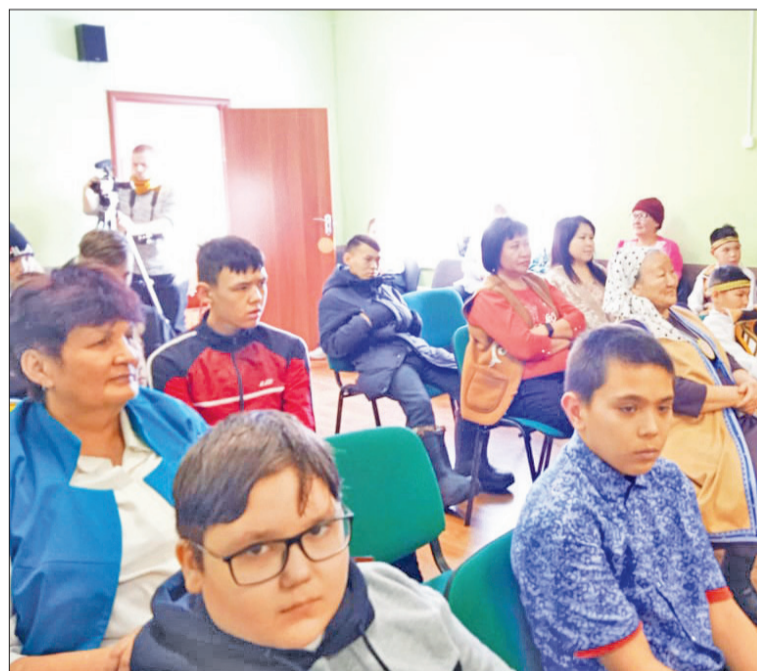
📷 Ангыптыкир зрителит-нидымнгар

■ Декада эвэды турэндули, культурали Эвенкияду ненгнениду нгэнэдерэн. Илан эктэнкирэ бегаду эр анганиду бикиттулэ Нидым нулгикит угирдерилнун эвэды турэнмэ, культурава суручэн. Хавамнил Эвэды краеведческой музейдук, Эвэды центральной библиотекадук, Этнопедагогической центрадук Нидымдулэ итыгалчатын. Упкат команда специалистал эвэды турэндули, культурали-да, мэннгил савадалва гачанум, сурурэ. Програмава умунупнэ очатын, он тар мероприятие нгэнэмэчин.