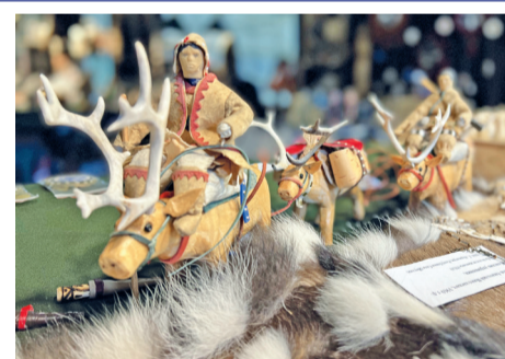
«Сокровища Севера» объединяют мастеров самых разных направлений

В рамках выставки пройдет всероссийский фестиваль культуры коренных малочисленных народов Севера, Сибири и Дальнего