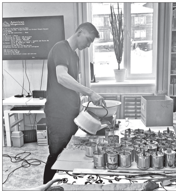
📷 Многие байкитяне готовы помочь военным

«Все для Победы! Вместе мы победим! Для нас это