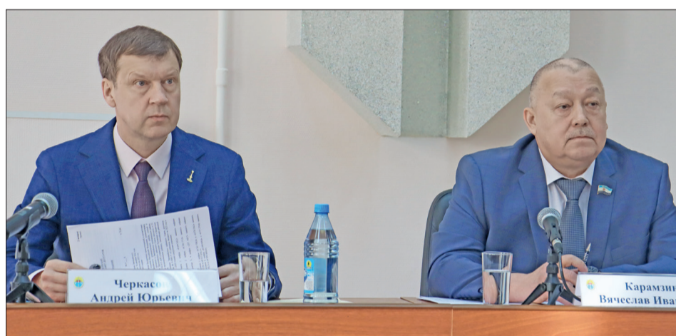
■ На мартовской сессии откорректирован районный бюджет