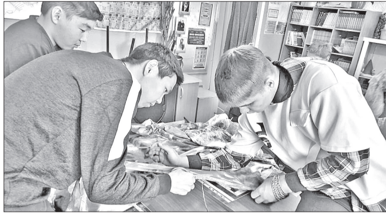
📷 Пошив нужных для бойцов вещей практически поставлен на поток

■ Оказать помощь военнослужащим-землякам, которые выполняют важные боевые задачи в зоне специальной операции, готовы жители села Байкит. Люди ежедневно, даже в выходные, приносят в организованные пункты сбора теплые вещи, продукты и многое другое.