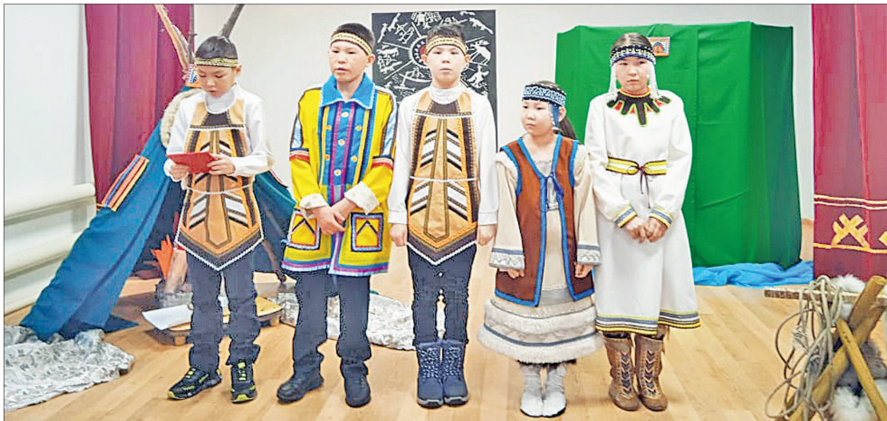
📷 Кунгакар чемпионаттули тангдэра