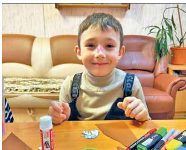
● Маленький творец добра