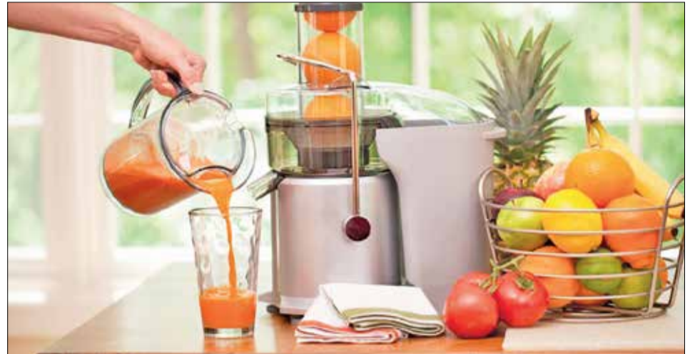
📷 Эффектно, но не практично