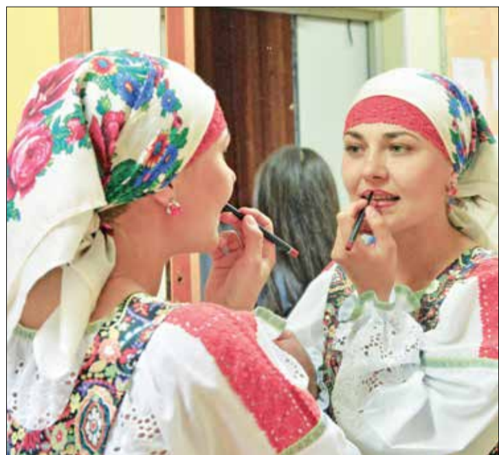
Женский штрих