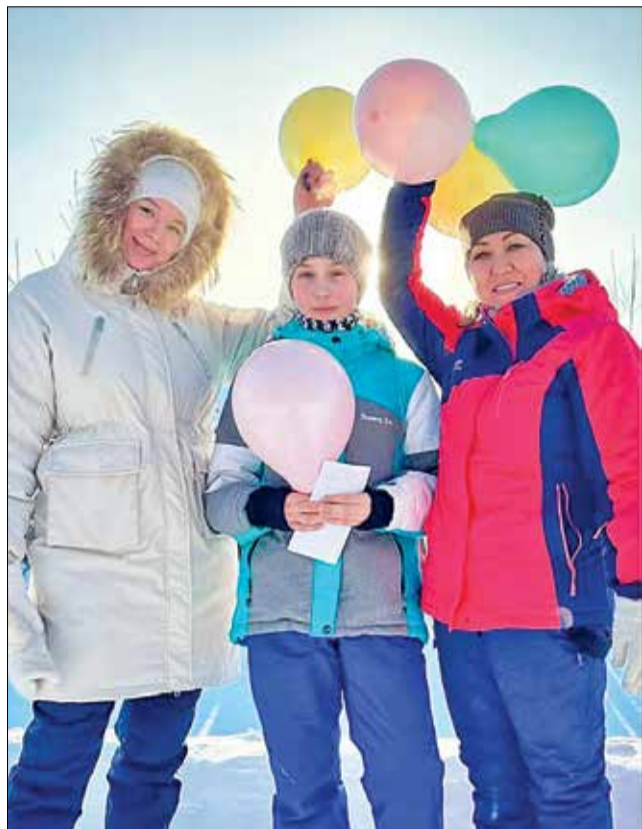
● Будьте внимательнее друг к другу – мир станет лучше