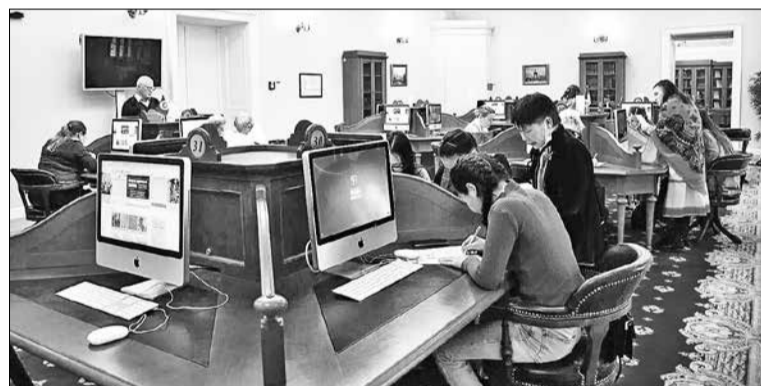
📷 Студентал-северяныл Санкт-Петербургдадук

Аят нгэнэрэн тар мероприятие! Тэде, эвэнкилду хэгды самосознание эмэрэн, анганитыкин кэтэ участникил эмэвил, мэрвэр-дэ ичэвкэнипкил, халтынду-да эвэды турэндули бэлэдевил. Тэгэл, амтыл турэрвэтын сот алагувдякаллу, одё-декэллу, нгэнэвдекэллу!