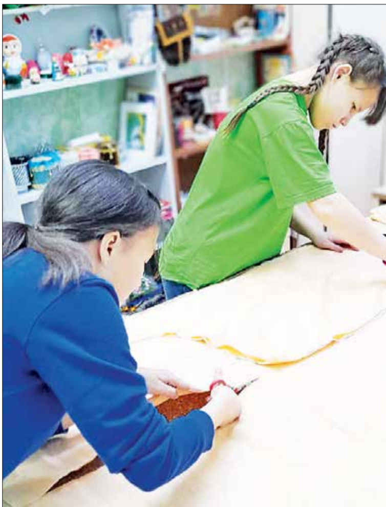
В детском доме шьют белье для раненых

Эвенкийские представительницы прекрасного пола вместе со всей страной помогают участникам СВО