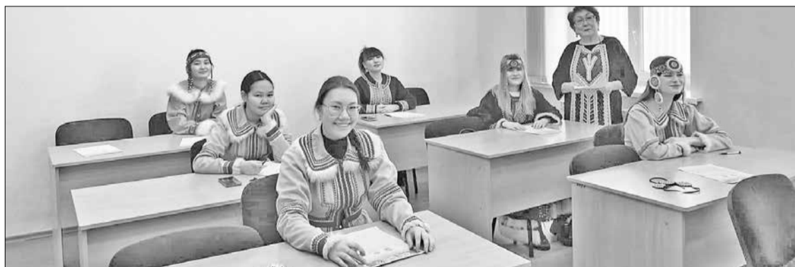
📷 Студентал эвэды отделениеду Улан-Удэдук