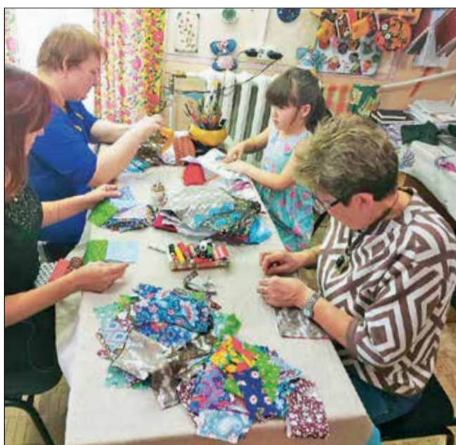
Волонтеры за работой