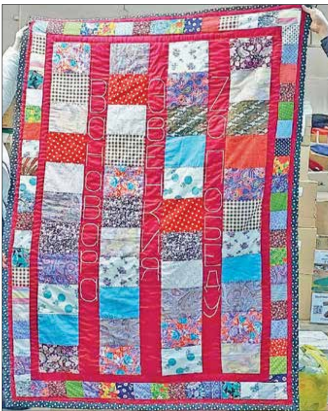
Это рукотворное одеяло для госпиталя изготовлено ванаварскими женщинами