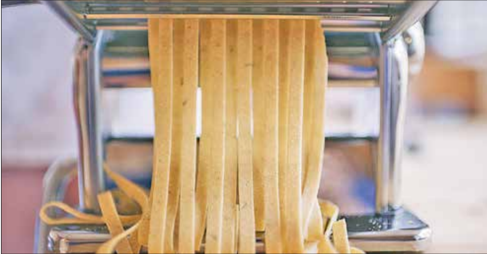
📷 Для ценителей тонкой домашней лапши