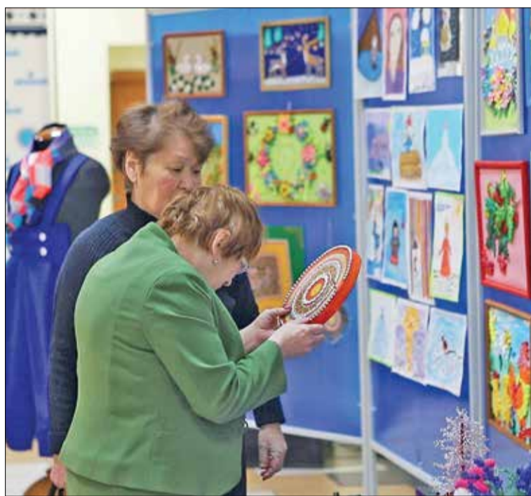
📷 Предстоящий год будет насыщен событиями с участием педагогов

Напомним, решением Президента России Владимира Путина 2023 год посвящен педа-