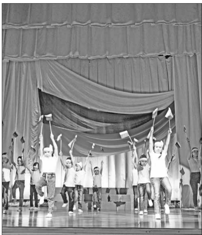
📷 В фестивале патриотической песни приняли участие 188 жителей Байкита