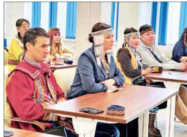
📷 На форум приехала и эвенкийская делегация

■ С 27 февраля по 3 марта в Красноярске проходит молодежный Суглан эвенков России.