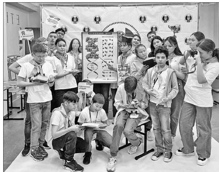
📷 Во время квеста ребята выполняли разные задания

Российское движение детей и молодежи «Движение Первых» образовано по распоряжению Президента России Владимира Путина. Учредительное собрание состоялось 20 июля 2022 года. Деятельность движения направлена на организацию досуга, создание возможностей для всестороннего развития и самореализации, а также профессиональную ориентацию детей. Вступить в движение могут ребята в возрасте от 6 до 18 лет, обучающиеся по программам начального общего, основного общего, среднего профессионального и высшего образования.