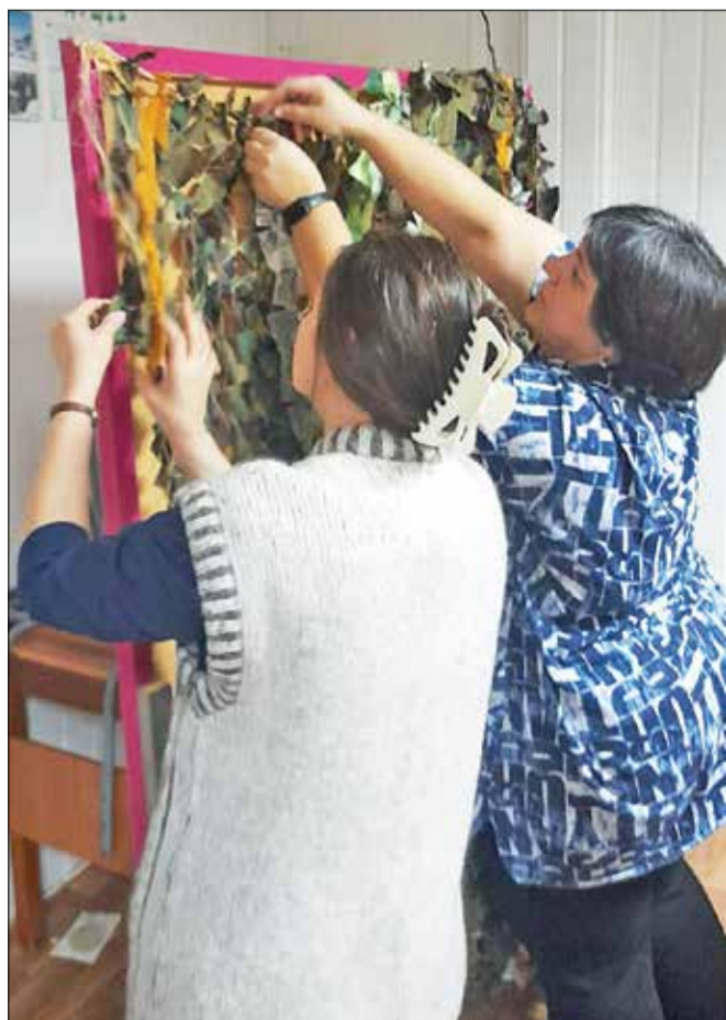
Закончили первую сетку...