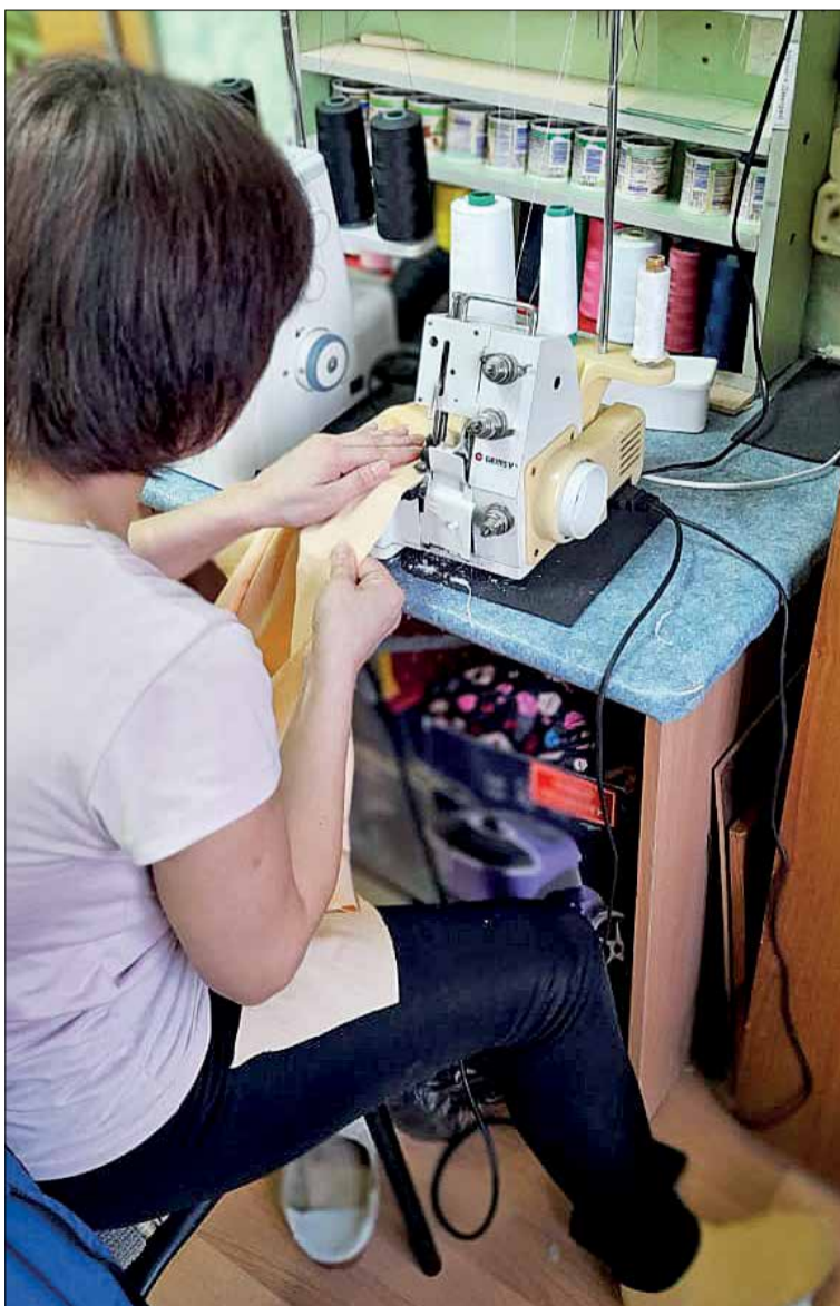
К активисткам присоединяются все новые жители села

■ Прошел уже год с начала специальной военной операции по уничтожению нацизма на Украине. Женщины разных регионов России делают все возможное, чтобы помочь бойцам, защищающим интересы России и Донбассе. Среди этих активисток – и наши женщины, проживающие в Эвенкии.