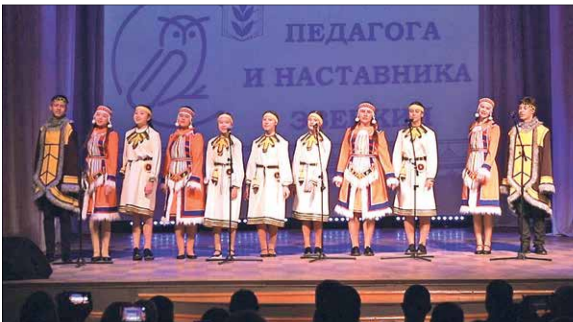
📷 На открытии школьники демонстрировали достижения в творчестве и спорте