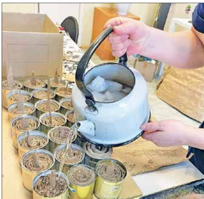
Так делают блиндажные свечи