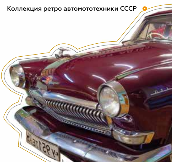
Коллекция ретро автотехники СССР