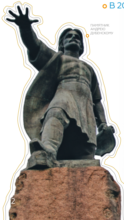
ПАМЯТНИК АНДРЕЮ ДУБЕНСКОМУ